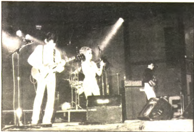
Una gala de la ONCE multitudinaria

AÑO XII INCA, PRECIO NUMERO 667 16 DE JULIO DE 1987 50 PTAS