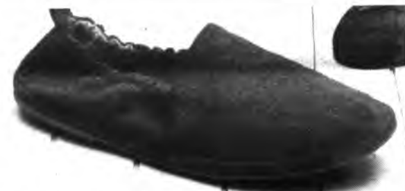
El calzado está atravesando un momento crítico.

La experiencia de INESCOP-Inca es muy amplia y está en disposición de aportarla a los problemas dia-