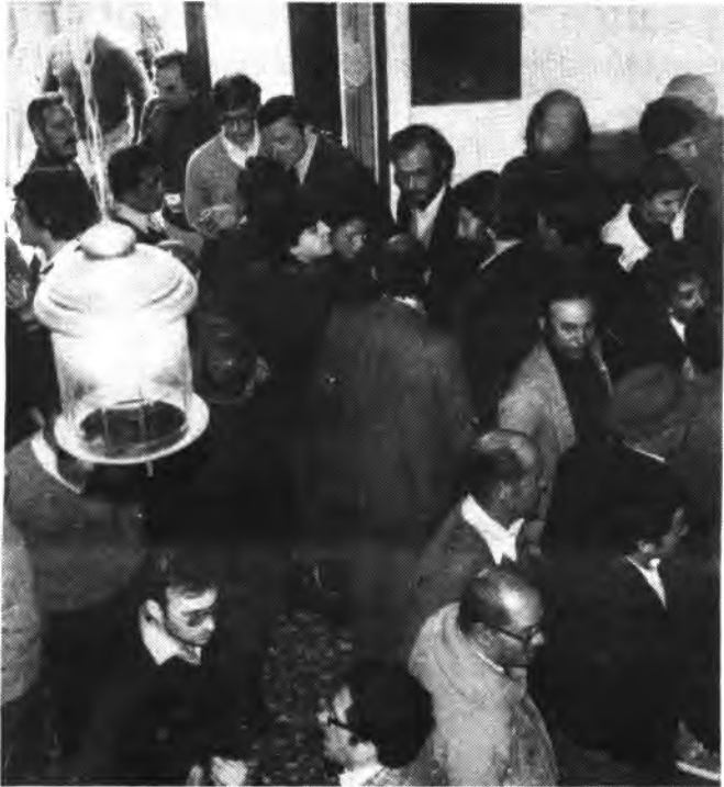
Toma de posesión del primer consistorio democrático.