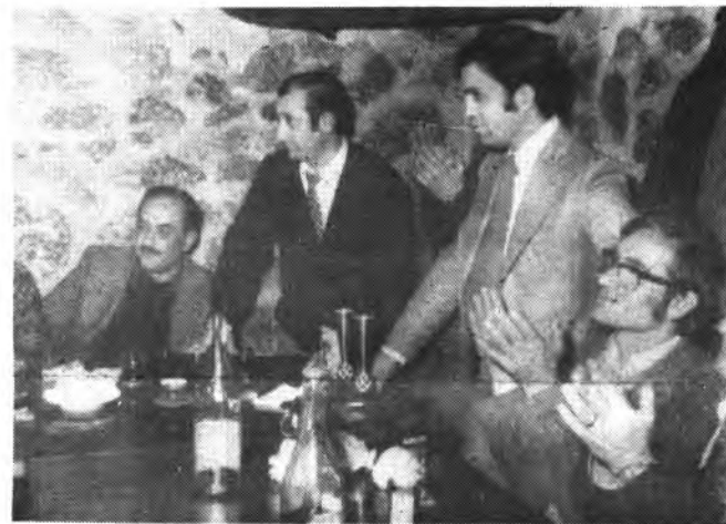
Enero de 1975, Bmé. Durán, rodeados de buenos amigos, amantes del fútbol..