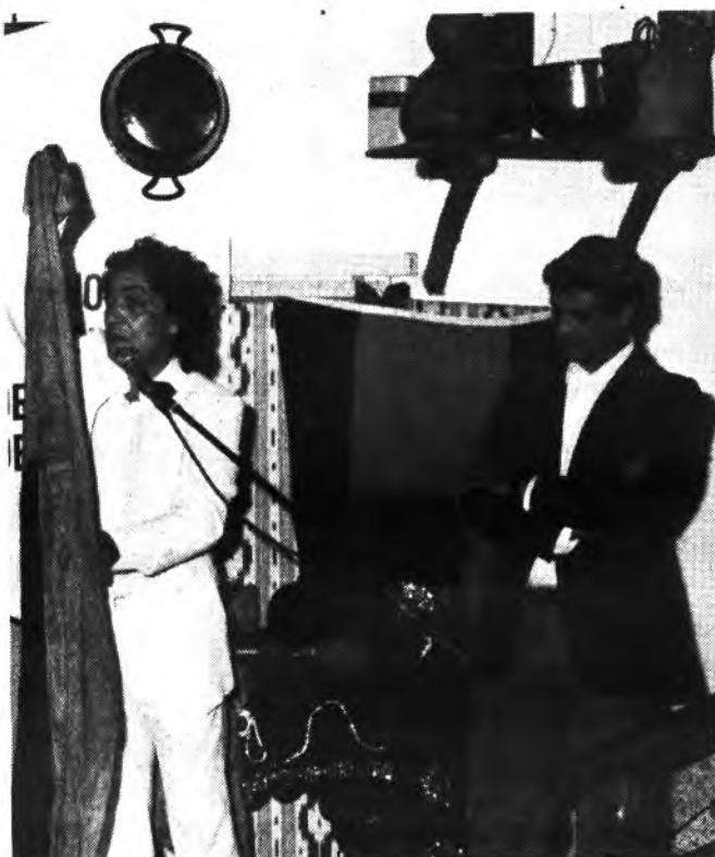
NERUDIN, una actuación muy aplaudida.