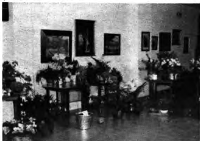
Detalle de la exposición de flores.