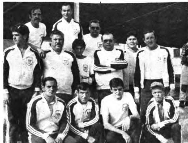
Unión Petanca Inca.