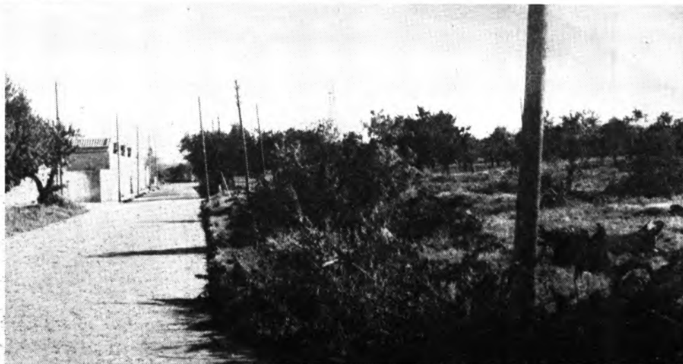
Detalle del polígono industrial inquense