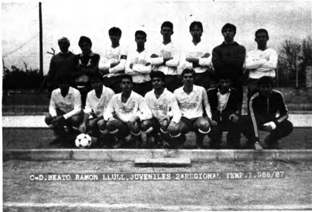
C-D. BEATO RAMON LLULL, JUVENILES 2ª REGIONAL, TEMP. 1.986/87

Equipo del Bto. R. Llull, Campeón de la Segunda Regional Juvenil: