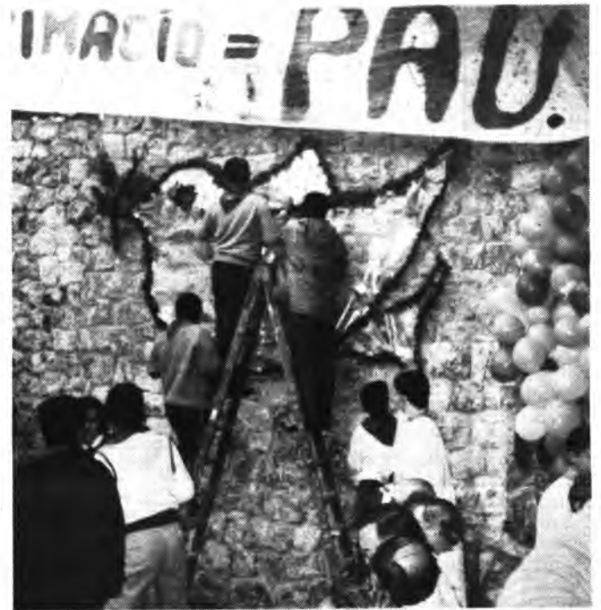
Detalle de la última edición.

El programa de la jornada es el siguiente: sobre las 10 de la mañana se reunirán en la plaza de los peregrinos, luego a las 10,30 habrá la salutación del Prior del Santuario Padre Juan Arbona, a los presentes. Luego a las 11,30, en el «Acolliment» habrá una celebración eucarística, mientras que a las 19 horas una vez finalizada la celebración religiosa habrá una comida de «pa amb caritat»