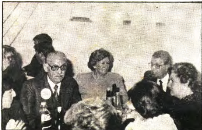
Mucha animación en la «II Nit Bullanguera»