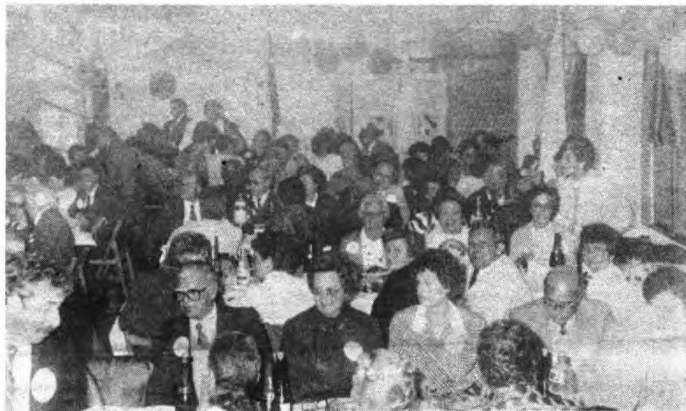
Detalles de la II Bit Bullanguera.