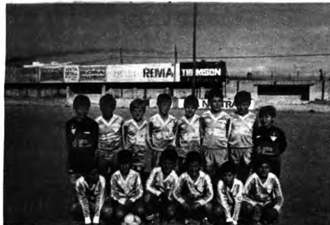
Equipo Benjamín del Sallista del Constanca.

Esperamos y deseamos que estas futuras figuras del fútbol local, continúen su brillante campaña y consigan traerse para Inca este importante Trofeo que patrocinara el Consell Insular de Mallorca.