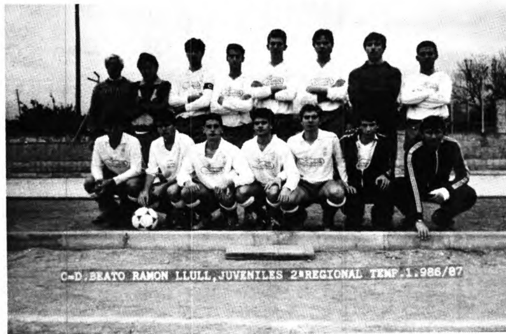
Equipo Juvenil del Bto. Ramón Llull.