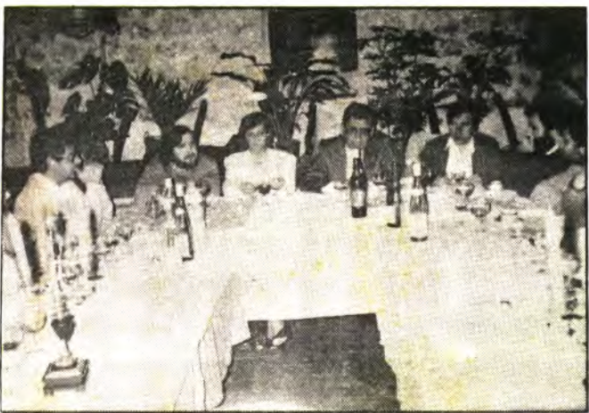
El President del C.I.M. se reunió con la «Premsa Forana»