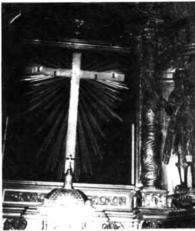
Foto nº2.- Detalle de la imagen encima de los bancos, en la misma se pueden observar grandes grietas. Esta restauración era de imperiosa necesidad.