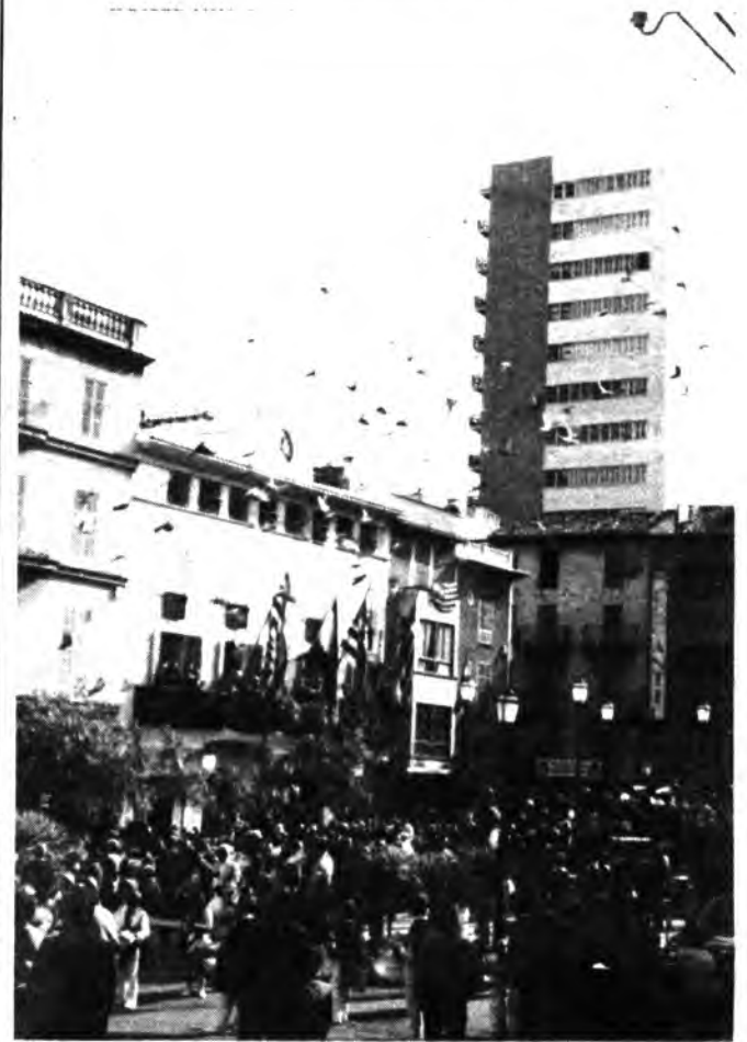
El pueblo, espera su turno ¿cual será su veredicto?.

Conforme se van cubriendo fechas, aumenta el ambiente que gira en torno a las próximas elecciones MUNICIPALES.