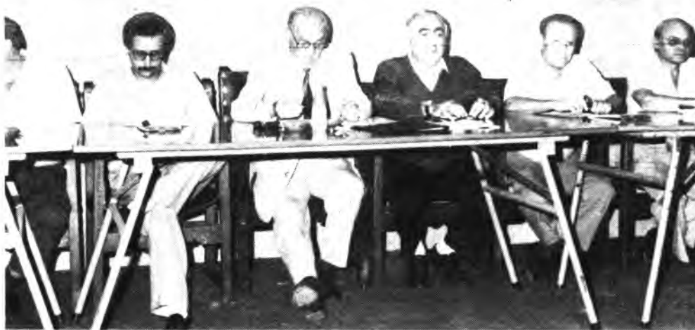
Los plenos comienzan a calentarse.