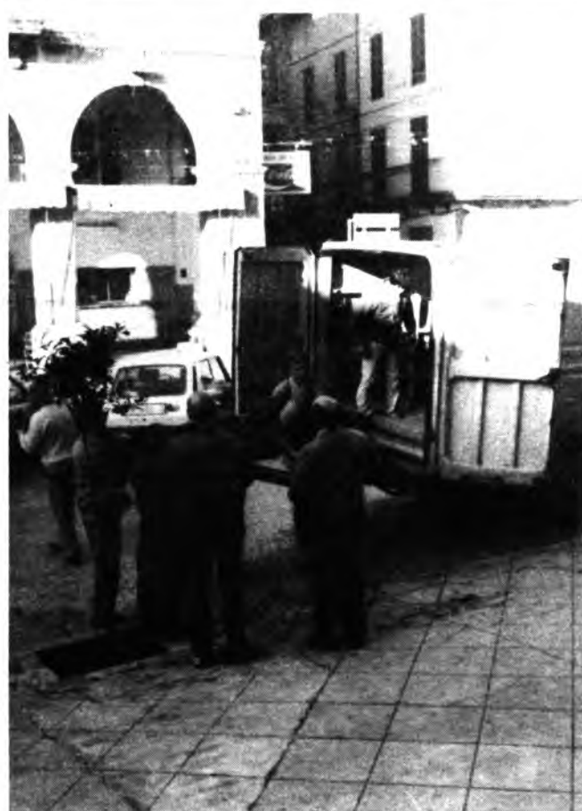
Foto nº7.- La imagen del «Sant Crist d'Inca» llega al Palacio Episcopal para su restauración en el taller del mismo.