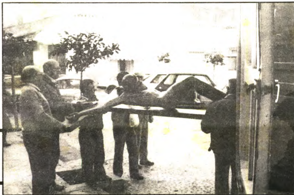
Foto nº6.- Varios miembros de la Cofradía del Santo Cristo ayudando a entrar la imagen en el camión.

EL LUNES «EL SANTO CRISTO», FUE TRASLADADO A PALMA PARA SU REHABILITACION