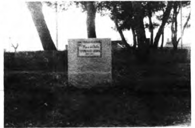
Detalle de la nueva rotulación. (Foto: Payeras).

Ahora la plaza o zona de esparcimiento cambiará de denominación dejará el nombre de «campet des tren» por el nuevo acordado hace dos años por el Ayuntamiento «Plaça del Batle Antoni Mateu» según reza en la placa que se ha colocado (frente a la plaza de toros). Antonio Mateu fue alcalde de nuestra ciudad en la etapa del franquismo siendo asesinado en Palma junto con el alcalde palme-