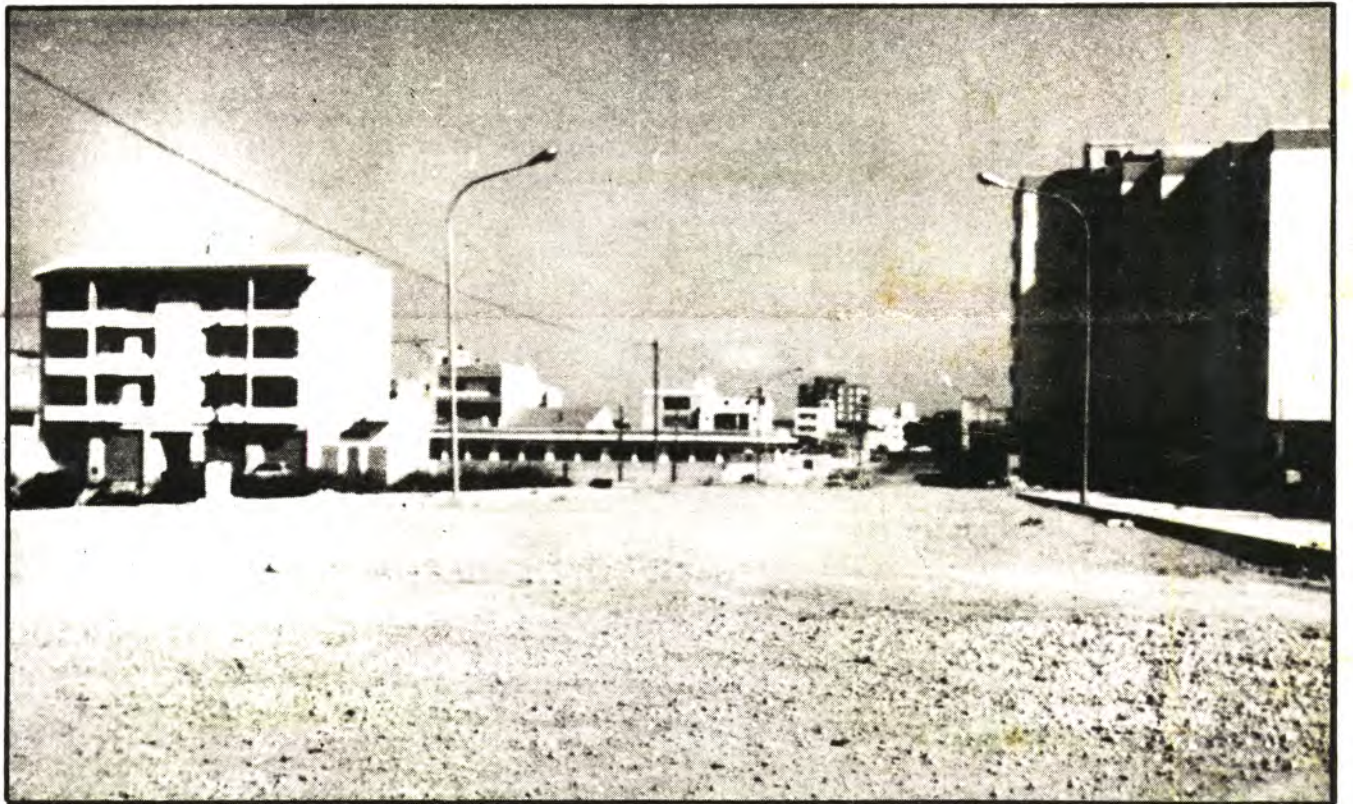
En dicha zona se han ampliado las calles y se prevee la pronta expansión

AÑO XII INCA, PRECIO: NUMERO 644 5 DE FEBRERO DE 1987 50 PTAS.