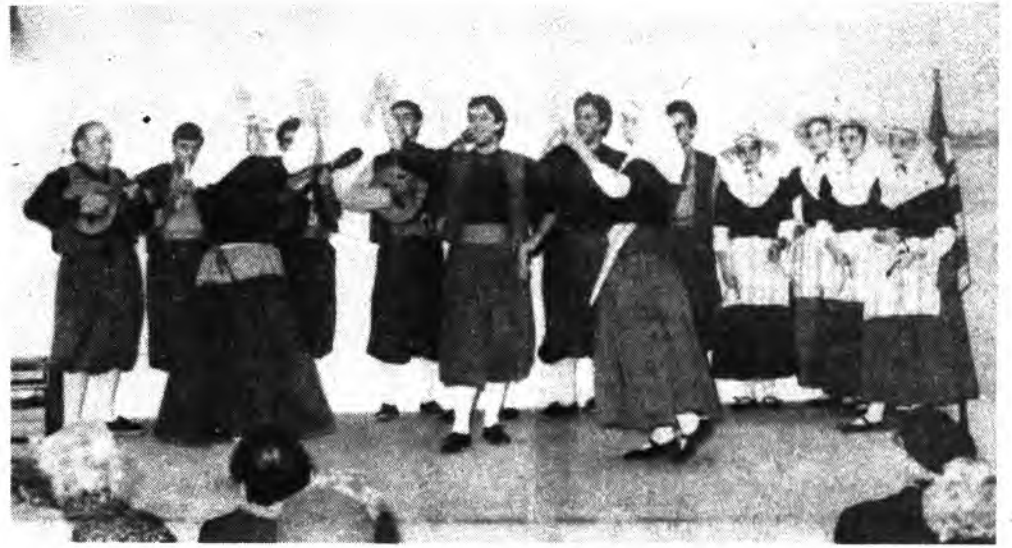
Actuación de la Rondalla Bellver.