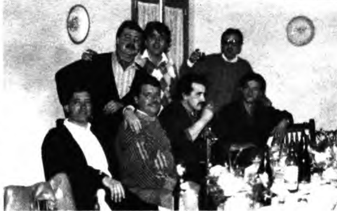
Detalle del acto.

año podamos celebrar el 18 aniversario, juntos y que a este le puedan seguir muchos más.