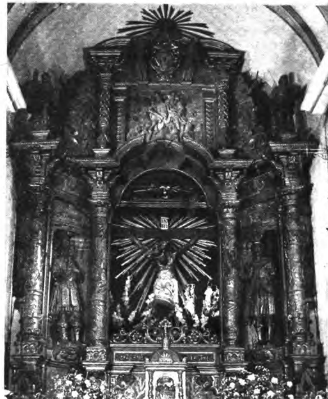
El Santo Cristo, será restaurado.

Los inquenses siempre han sabido responder ante llamadas de este tipo, por lo que se espera que respondan a este llamamiento que ahora se les hace.