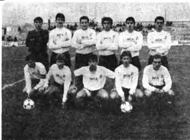
Equipo del Constancia.

De todas formas, aún cuando se dejaron de ganar uno ó bien dos puntos, no hay que conceder más importancia a esta última derrota. Al contrario, hay que ol-