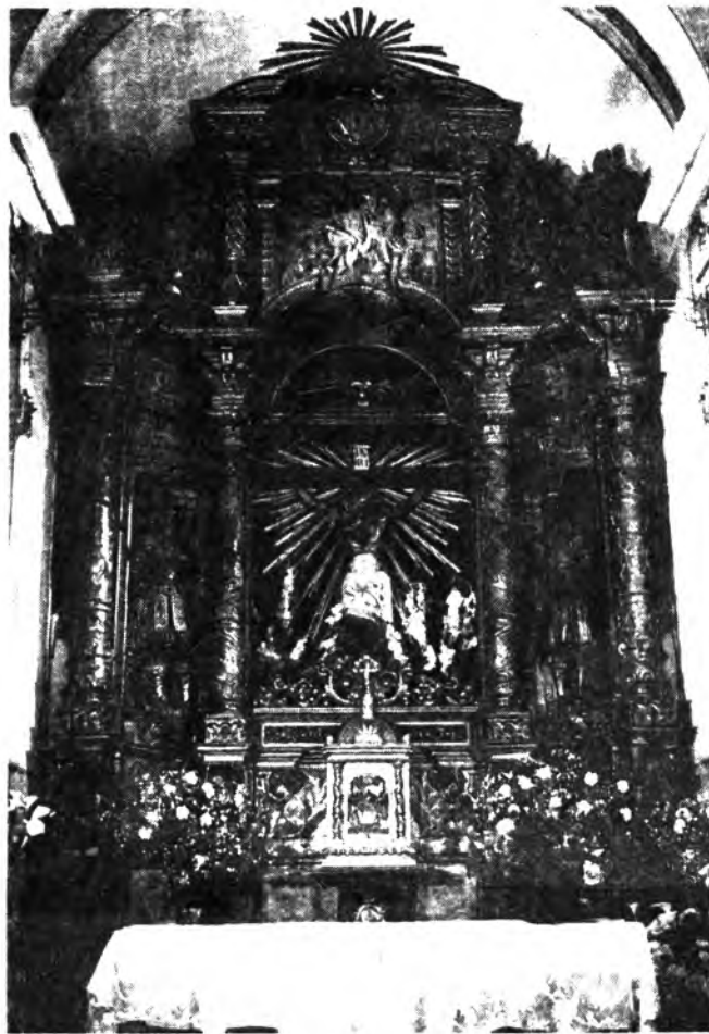
Retablo de la capilla.