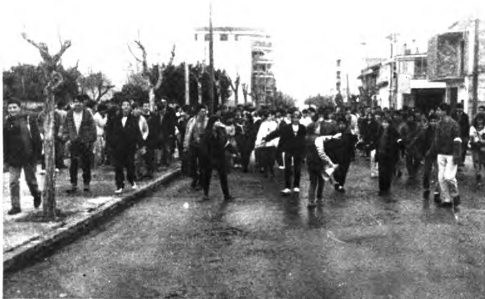
Detalle de dicha manifestación.