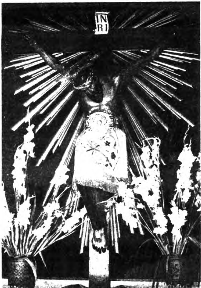
Detalle del Sant Crist d'Inca.