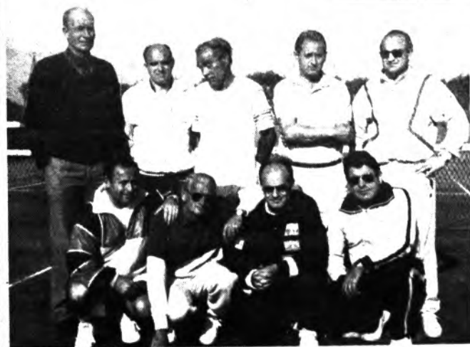
Equipo del Sport Inca.