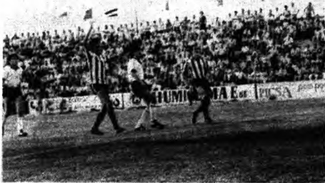
Por cierto, un directivo del Constanca, no comulga

con estas cenas que se ofrecen en la Heladería Las Palmeras, hasta el extremo, y este es un extremo que nos fue comunicado por parte de unos directivos, que este directivo presentó la dimisión de su cargo por no compartir mesa con los anfitriones de estas cenas. Ya que considera que estas cenas, resultan contraproducentes para algunos apartados relacionados con el club.