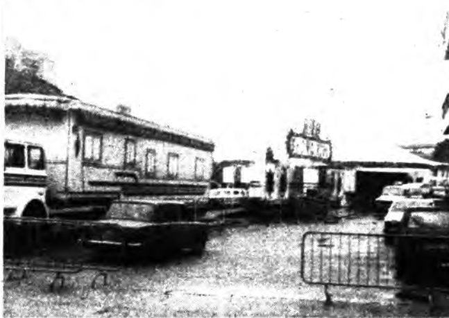
El circo hizo las delicias de los pequeños.