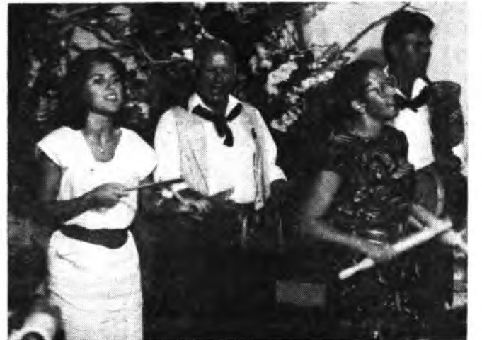
«Revetla d'Inca», estará presente en el homenaje. (Foto Andrés Quetglas).

Recordamos, para la retirada y reserva de tickets, deben llamar al teléfono 501985 a partir de las siete treinta de la tarde.