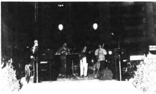
Otro detalle del grupo Sis Som.