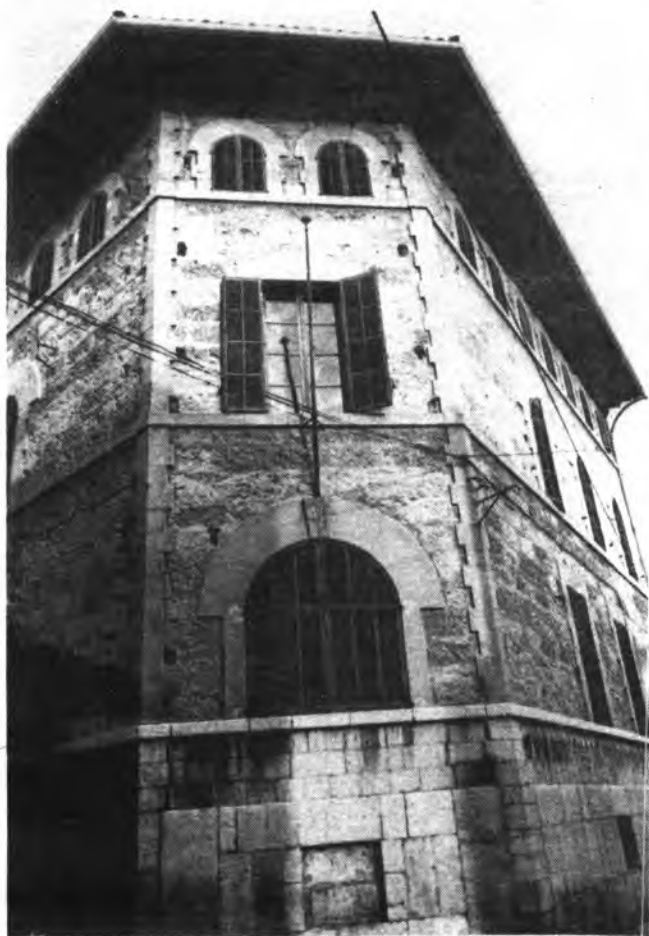
Detalle de la residencia de ancianos.