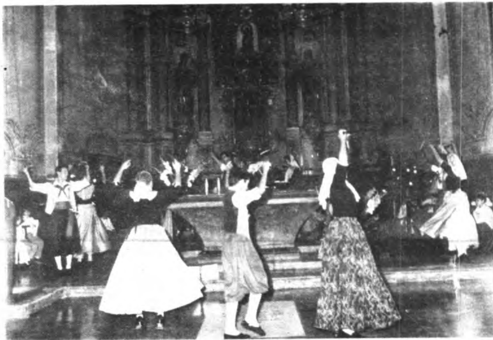
Entrañable homenaje a nuestros mayores en la parroquia