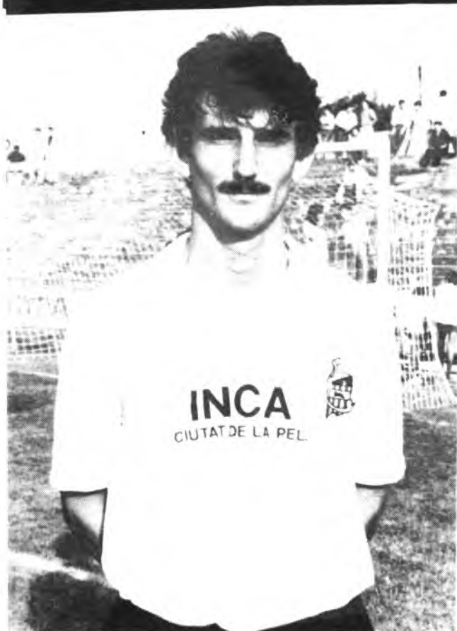
Bibiloni, un valladar en la defensa del Constanca.