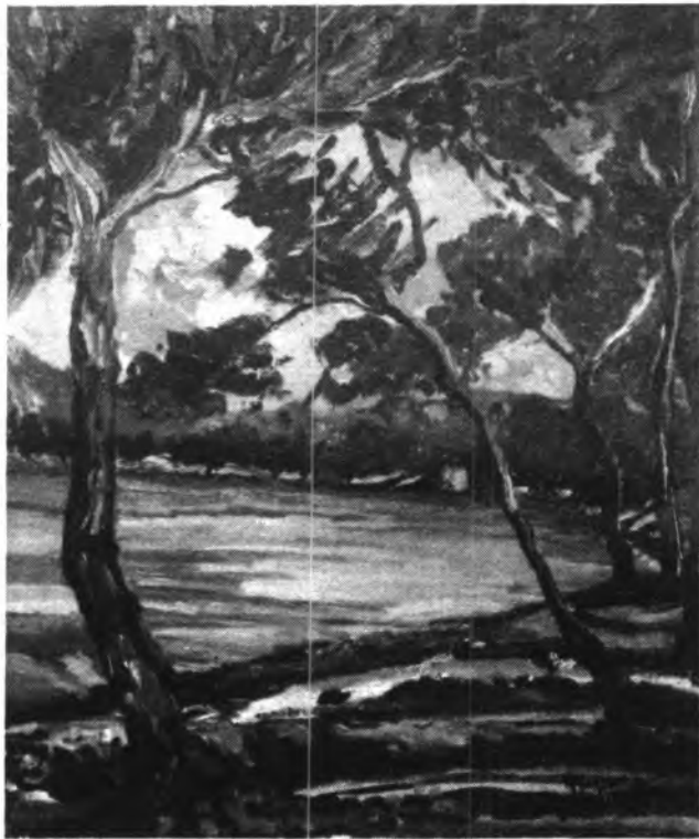
Detalle de la obra que realiza.

—Me gusta mucho pintar Pollença y todo su entorno. Me hace ilusión que la gente vea lo que