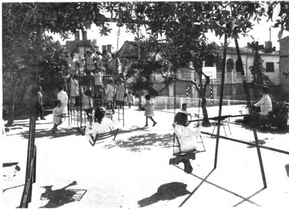
Detalle del colegio.