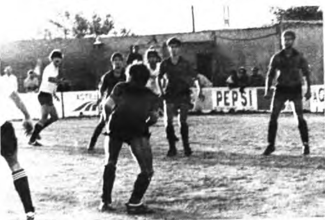
El Constanca sigue imbatido.