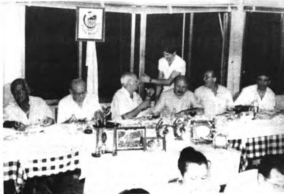
Detalle de la presidencia.