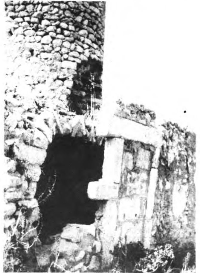
Detalle del molino situado junto a «Sa Pota del Rei», en el Serral.

En pocos años hemos visto como dos molinos de distintas zonas de la ciudad han desaparecido. Se tendría que intentar que estos no desapareciesen ya que además de los del «Serral» hay en nuestra ciudad el «moli d'en Barona» y el «Moli den Bennisar». Además del situado junto al campo de fútbol del Constançia. «Es Molins del Serral» se caen. Es cierto que algunos particulares han procedido al arreglo de los mismos tanto en su interior como en la fachada. Dos de ellos han sido adecuados por sus propietarios y los emplean como vivienda. Pero por desgracia esto no ocurre con todos, ya que uno principalmente el situado junto a «Sa Pota del Rei» cada día está peor además de haberse estropeado