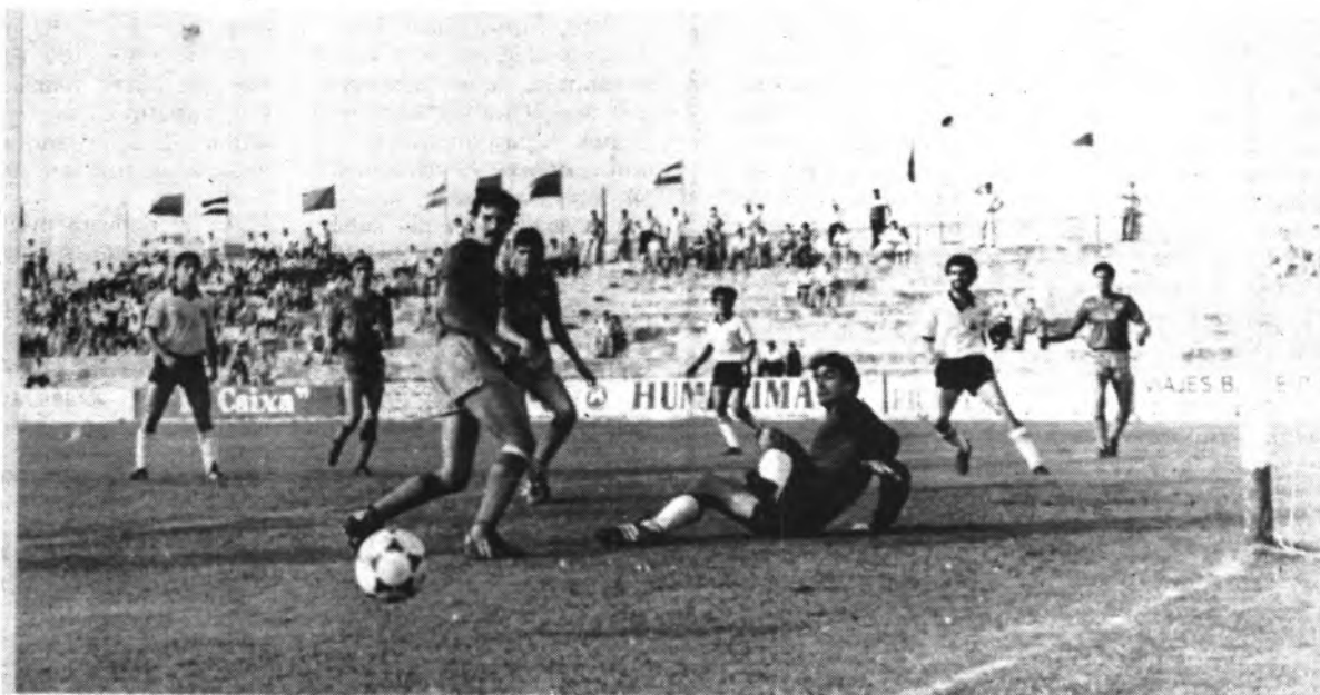
El Constancia vela sus armas para la próxima liga.