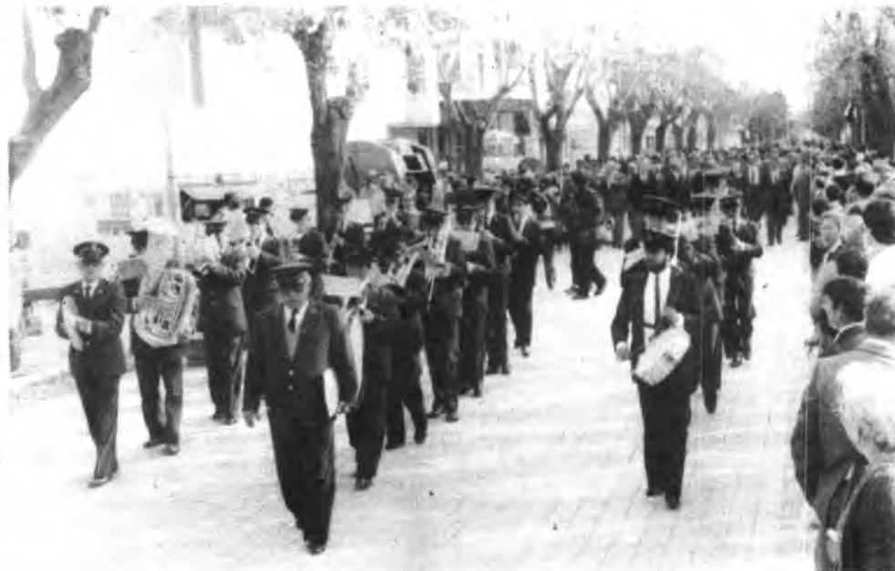
Detalle de la Banda Unión Musical Inquense.