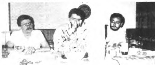
Detalle de la presentación de Izquierda Unida.