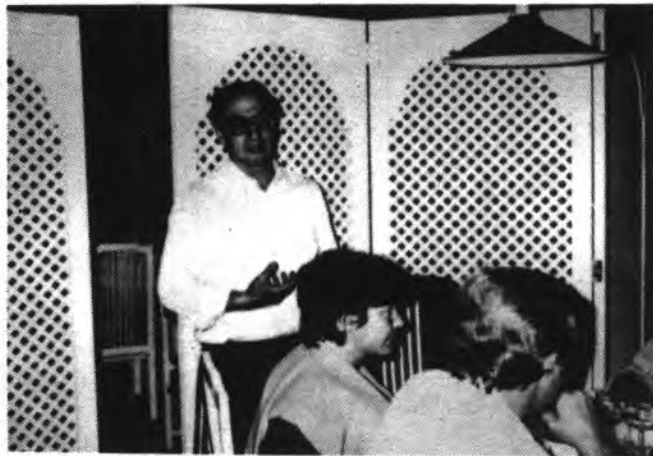
Detalle del parlamento de Damià Ferrà-Ponç.

El pasado viernes se celebró en la "Pizzería" la presentación oficial de la candidatura del PSM, (Esquerra Mallorquina), cara a las próximas elecciones generales.