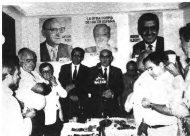
Detalle del parlamento de Antonio Pons.