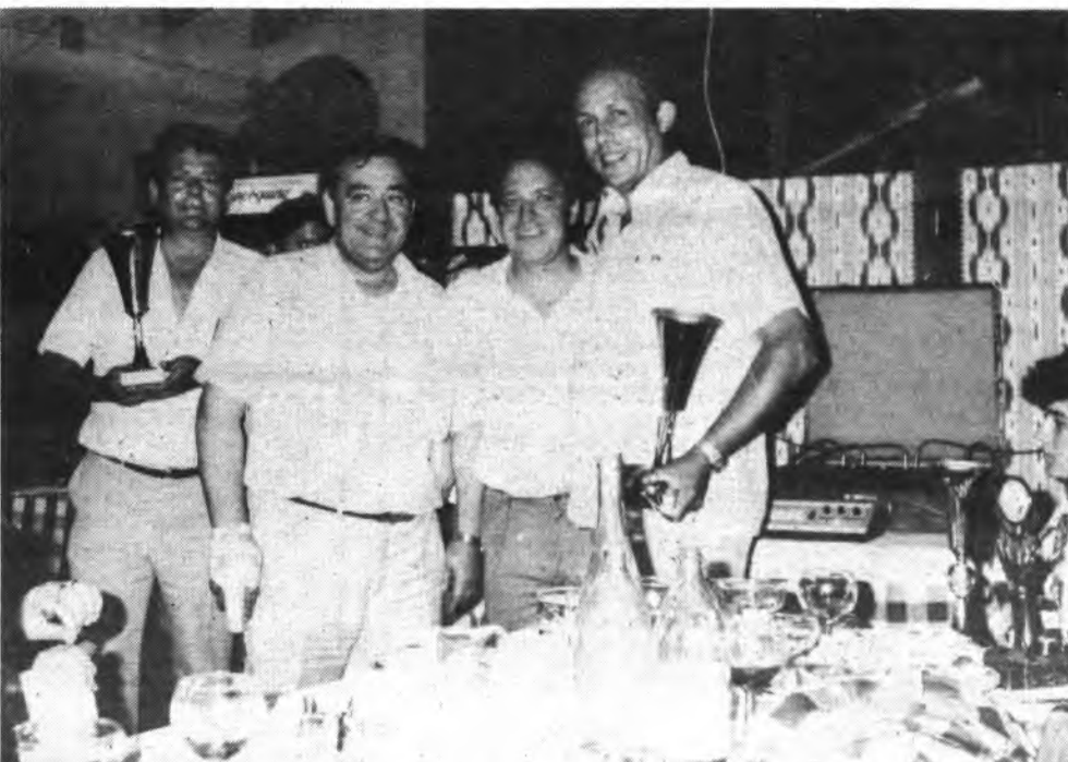
Detalle del acto