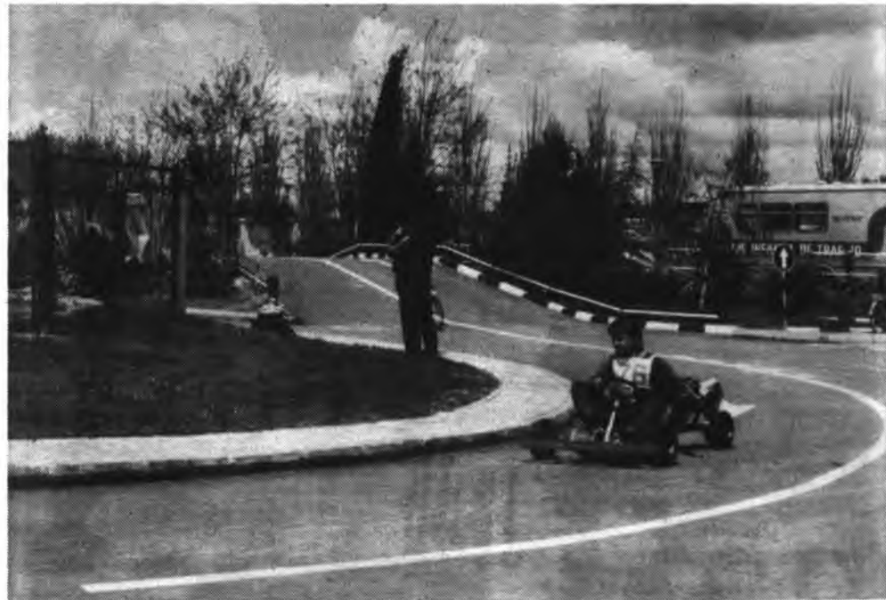
Un alumno inquense en las pruebas granadinas.

Aunque no se haya notado mucho en la prensa, 1986 es el año Europeo de la Seguridad Vial.