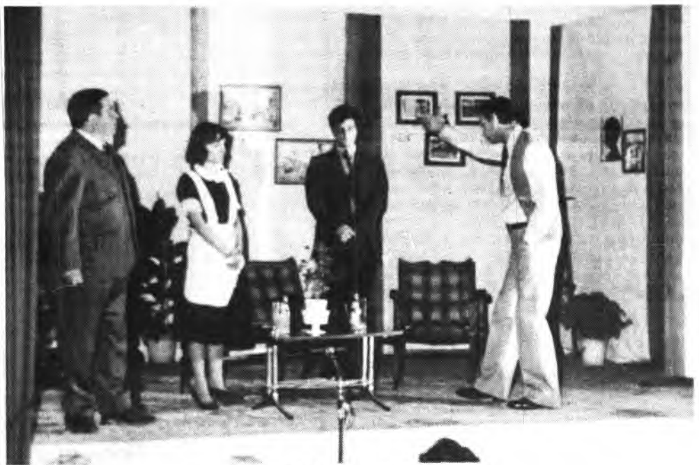
Detalle de la obra "Na Tinon."

De nuevo comienza el peregrinar por pueblos presentando ese espectáculo vibrante del teatro siempre