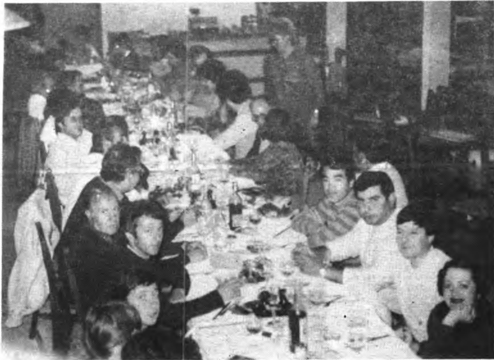
Aparte de saber jugar como se debe al TRUC, los amigos del Bar Novedades, saben de los buenos guisos.