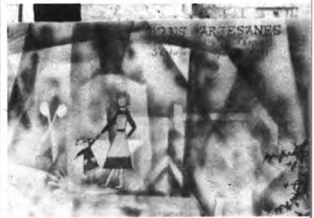
Detalle del Mural.