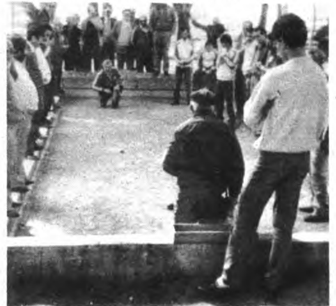
La emoción, estuvo presente en todo momento en la confrontación.