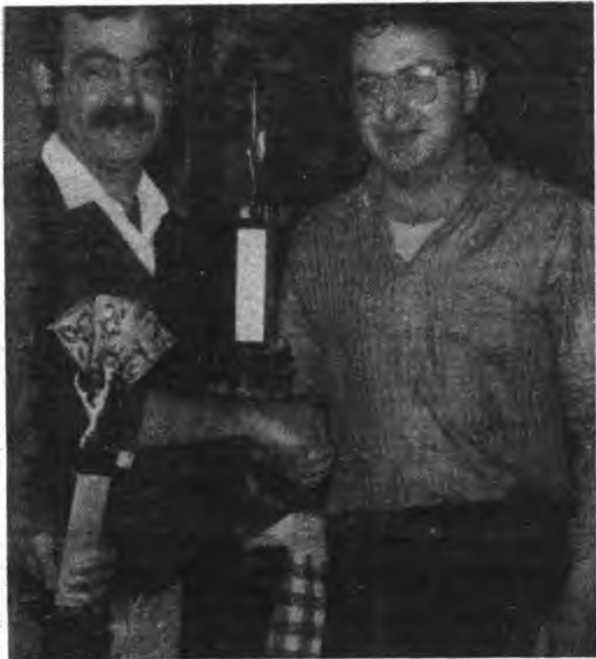
El organizador del torneo, haciendo entrega de un trofeo.