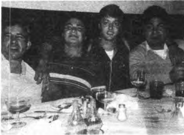
Los Fernández y Cia., fueron la gran atracción de la noche.

Ya, casi cerrando la cuenta, nos topamos con Santiago y Fernández, el