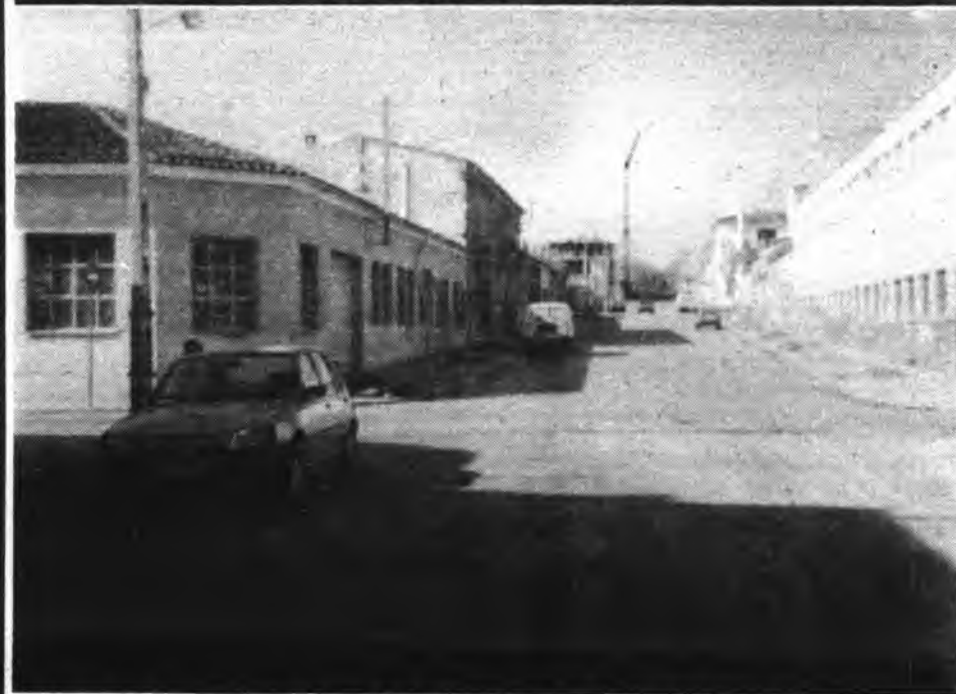
Calle Rafael Alberti, el mismo día de iniciarse la masiva plantación de árboles.