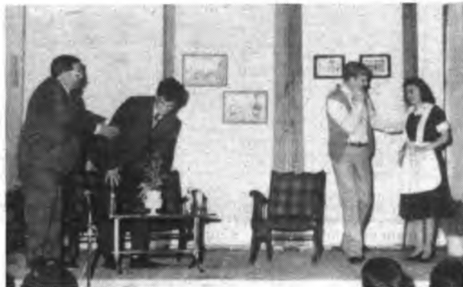
Detalle de la representación de "Na Tinons."