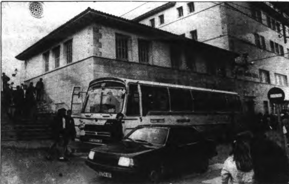
Un sector de padres de alumnos de los cursos que continúan en activo quieren que se cierre el centro completamente, mientras que otros encuentran la medida exagerada

Acabó diciendo que el doctor Seguí se había interesado vivamente acerca de la dirección del centro sobre los casos «por lo que nosotros nos sentimos optimistas de cara a la pronta y definitiva solución de este asunto».