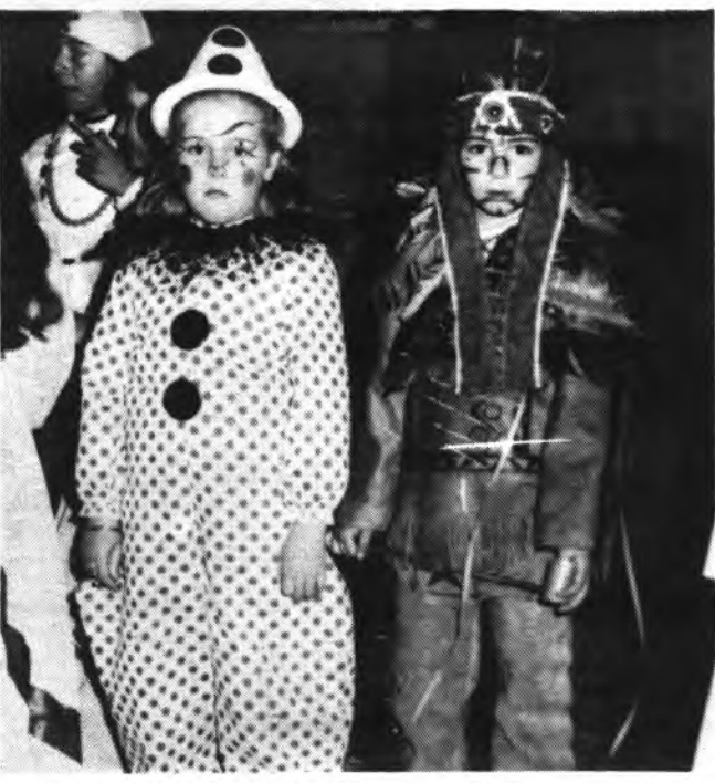
Detalle de la Rua, del pasado año.

OMO YA informábamos pasada edición el supuesto de las fiestas carnaval 86 de este año enden a 1.400.000 etas, presupuesto siblemente superior a s ante riores. Esta tidad ha sido posible ías al esfuerzos de la egación de Cultura del untamiento que ha seguido la cantidad de millón de pesetas para s fiestas y además se ta con la colaboración Consell Insular de orca, que aportará la tidad de cuatrocientas pesetas. e espera que el número carrozas que tomarán te en la "Rua 86", erará con creces el iero de 30. El programa ial una vez efectuados últimos retoques es el damos a conocer. as fiestas del Carnaval o viene siendo norma sido organizadas por la egación de Cultura del untamiento, Grup splai S'Estornell, Obra tural Balear, Colegio lico "Ponent", Grup oi, Asociación de la cera Edad de Inca y arca. Colaboran en las mas, Asociación de mos "Ponent", Colegio lico "Llevant", Colegio la Pureza, Instituto enguer d'Anoia, Colegio lico "Ponent", La Caixa, Nostra, Cooperativa esa, Revetla d'Inca, eciación de la Tercera d de Inca y Comarca.