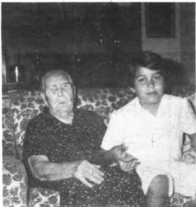
"Sa padrina", con un biznieta.

"No está bien esto del divorcio ni tampoco el aborto. Yo no me habría separado nunca de mi marido"