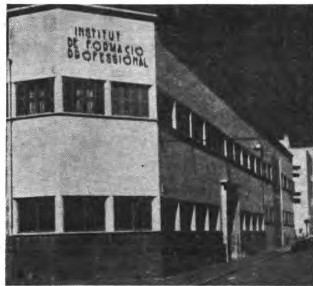
Detalle de la fachada del Centro.