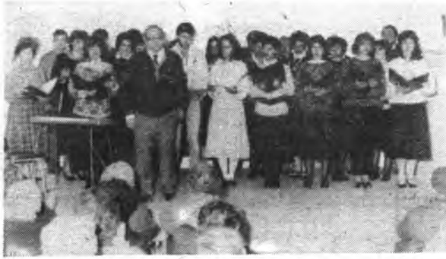
Coral de Pollença.