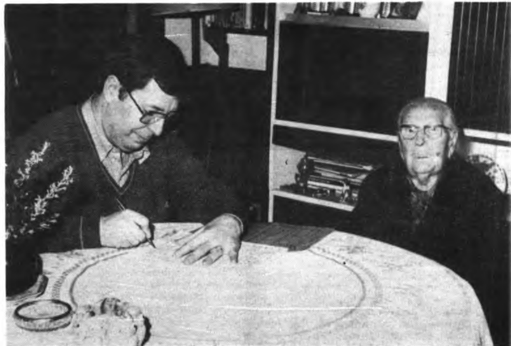
La centenaria hablando con nuestro compañero.

—Antes había más tranquilidad que ahora. Pero ahora se vive mejor, hay más