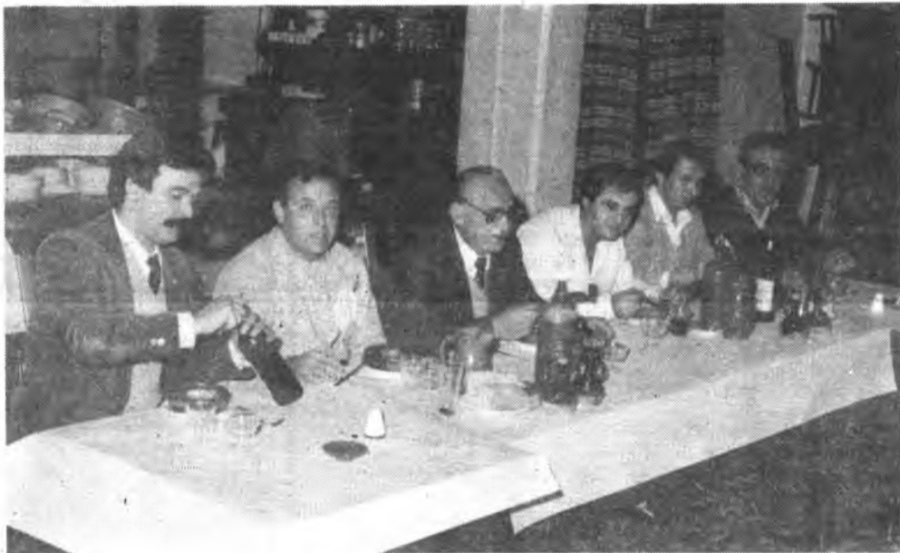
Mesa presidencial.

Por cierto, que en el transcurso de la cena, tuvimos la suerte o desgracia de contar con la pareja conocida como "DINAMICA", y que una y otra vez, se vanagloreaban