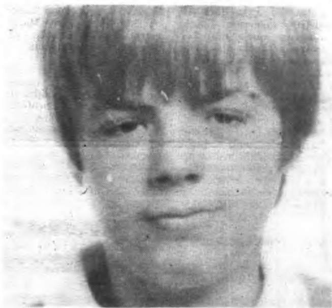
Amengual, un valor en alza.

Por lo que concierne al colegiado de turno, debo catalogar su actuación de nefasta y pésima, habida cuenta que sus errores fueron reiterados, de auténtico bulto, y si no provocó un altercado, obedeció en gran parte a la serenidad y deportividad demostrada por los visitantes. En la segunda mitad, barrió descaradamente a favor del equipo local, dejando de señalar entradas alevosas de algunos