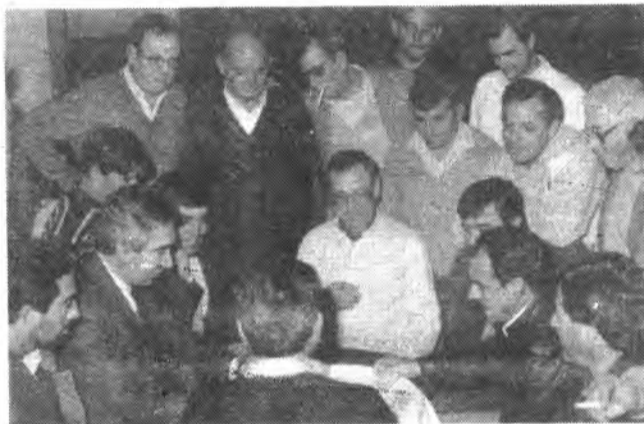
Un momento de la partida de desempate, entre las parejas clasificadas en primer y segundo puesto.