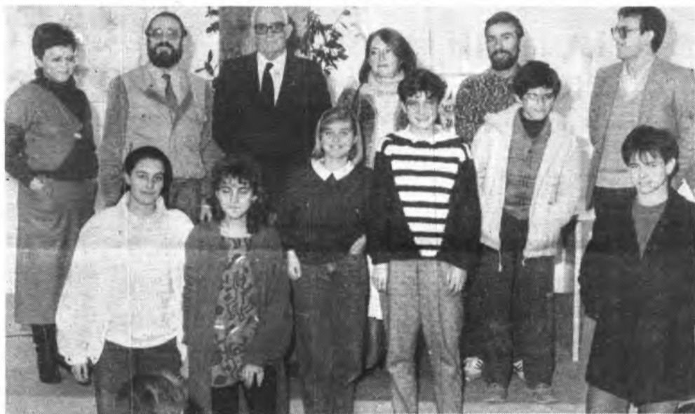
Detalle del acto.

Recordant els 40 i pico d'anys que hem anat junts