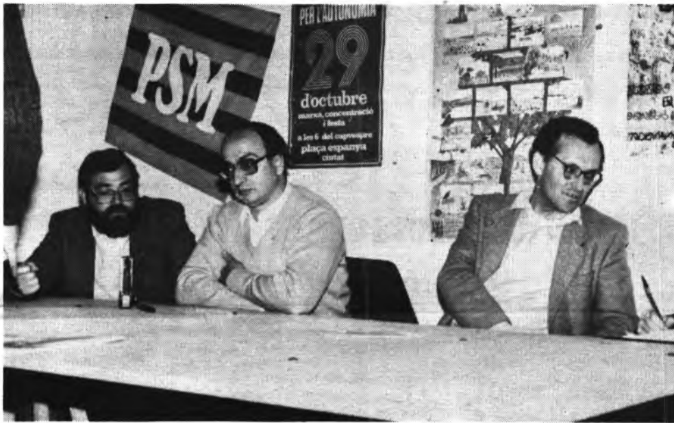
Detalle del acto.

Luego en la "Pizzeria", se celebró una cena de compañerismo a la que