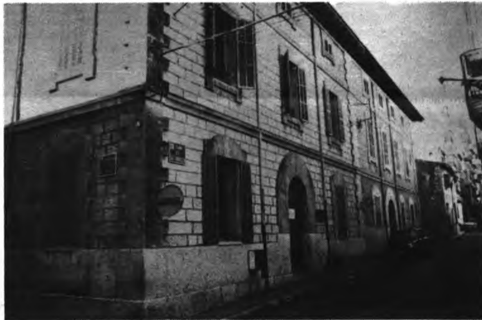
Colegio San Vicente de Paul.

En esta misma línea, cabe destacar la actuación del Coro del Colegio con alumnas de 5o, 6o, 7o y 8o, siendo muy aplaudida su