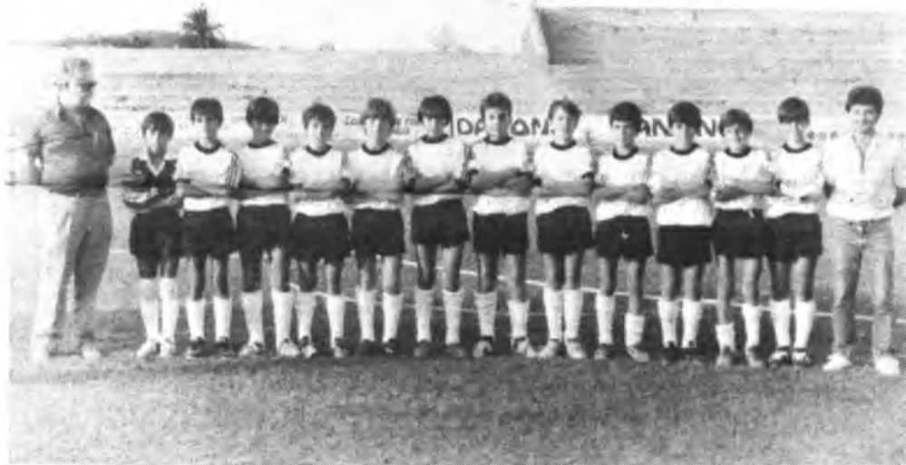
Equipo Alevín del Constanca, brillante vencedor en Santa Margarita.

No tuvo excesivos problemas el Infantil del Sallista Constanca para vencer y golear al equipo Infantil del España de Lluçmayor.