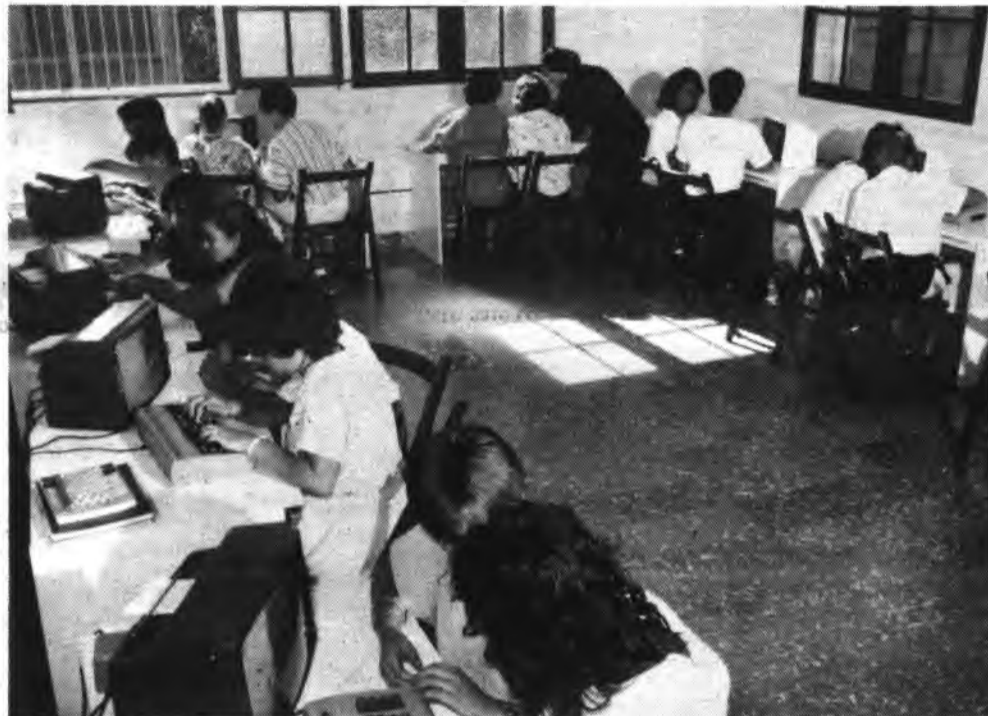
Detalle de una clase de informática de la Pureza.

Estuvimos en el colegio y mientras nos mostraban las nuevas dependencias y los 10 nuevos ordenadores, estuvimos dialogando con la