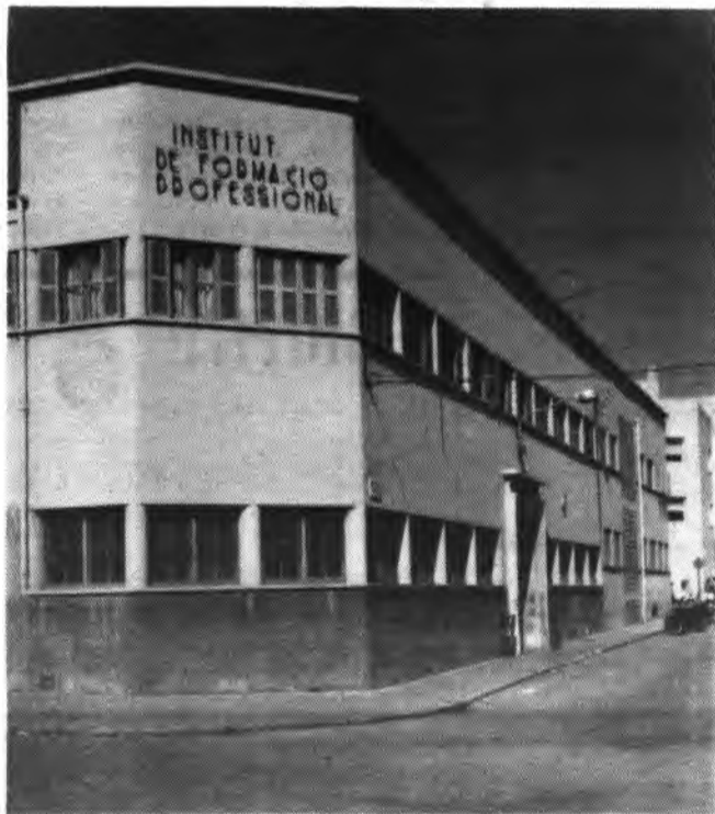
Institut de Formació Profesional.

Exactament, ja que qualsevol accident que es pugui produir es contemplat al Segur Escolar i per una altra banda l'Associació Empresarial, la