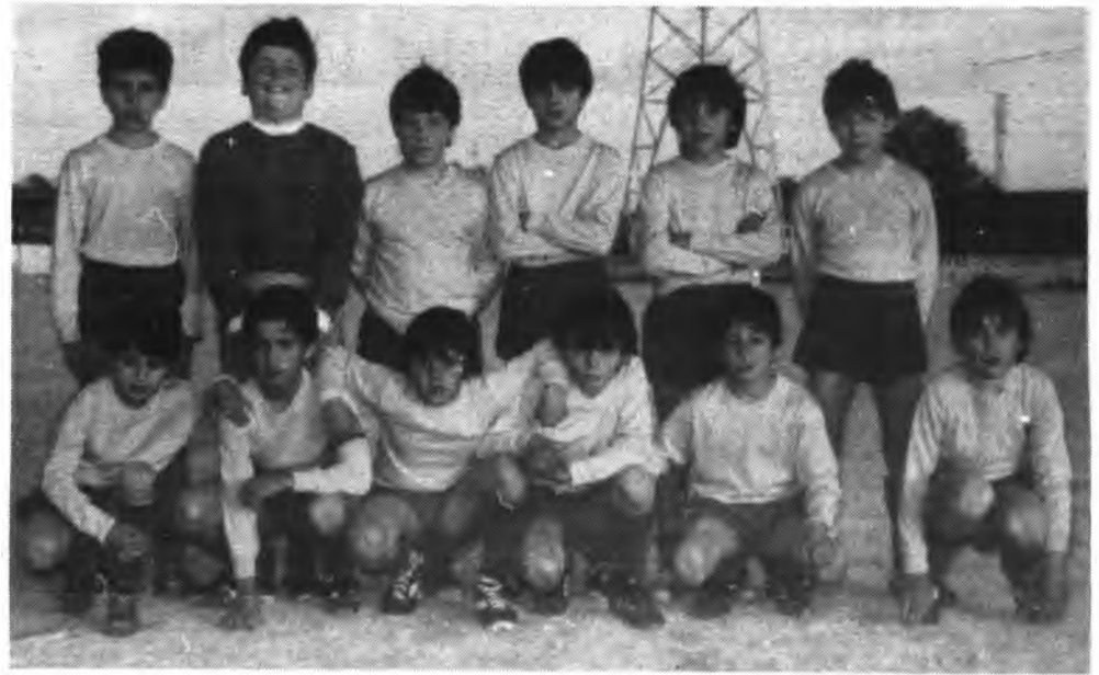
Equipo benjamin B. del Sallista.

De salida, el Sallista se adueño del centro del campo, llegando sus delanteros con facilidad hasta los dominios del meta visitante que, a poco de