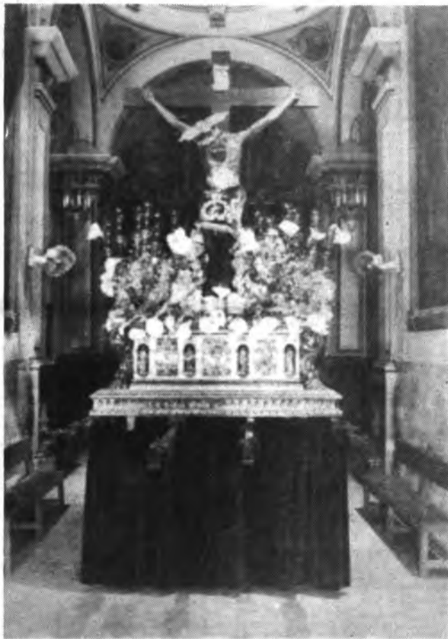
Imagen del Santo Cristo de Inca.