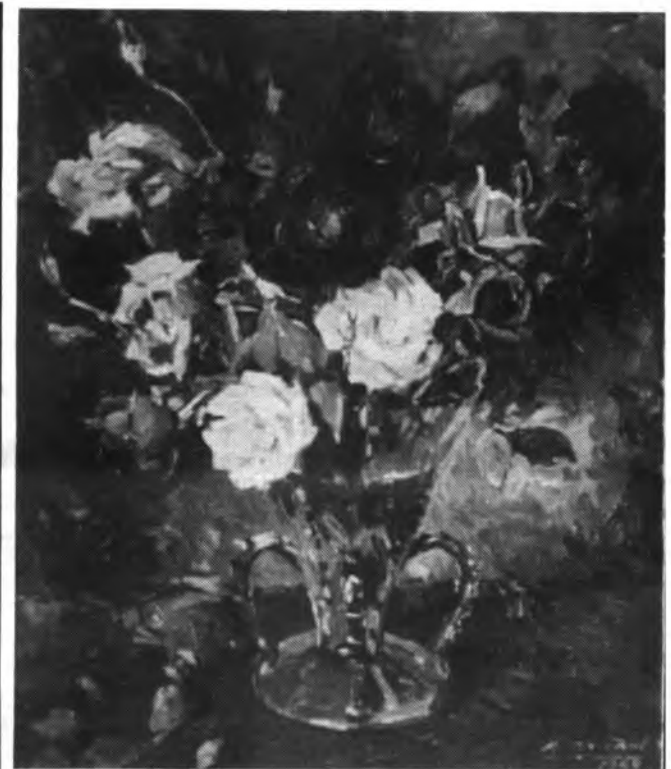
Detalle de la obra de Ramón Nadal.