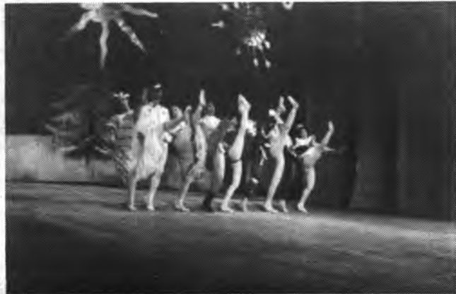
Ballet del Mediterráneo, que actuará en Inca.