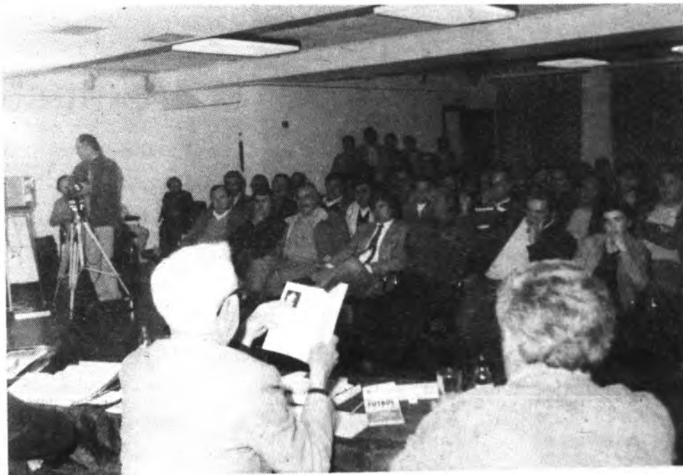
Mucho público asistió al debate.