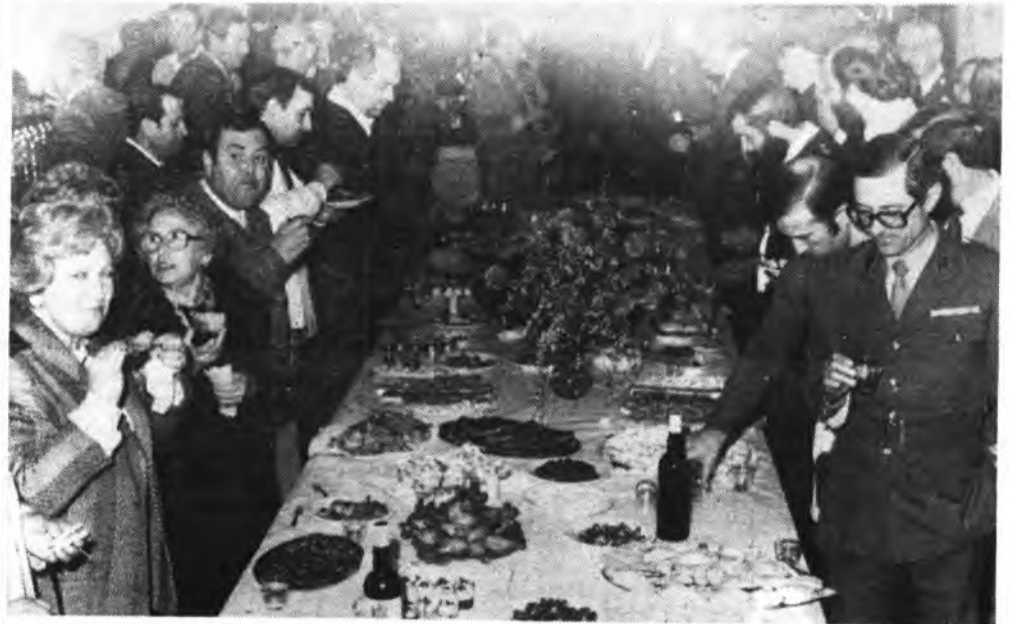
Detalle de la fiesta de la Policía Municipal.

El pasado sábado la Policía Municipal inquense, celebró su fiesta patronal en honor de su patrono "Santo Angel Custodio". Para esta celebración contó con la colaboración del Ayuntamiento inquense.