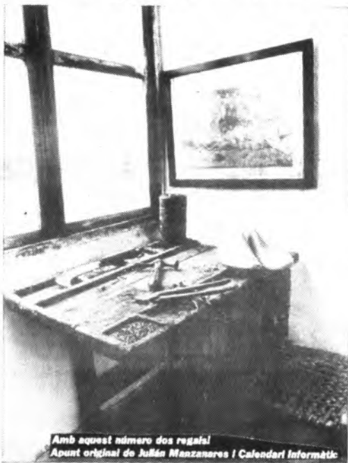
Amb aquest número dos regals! Apunt original de Julián Manzanera i Calendari Informàtic

Acaba de salir a la calle el número 9, de la revista de información inquense Raiguer. El número 0 salió con motivo del "Dijous Bo" del año 83, del cual dimos cumplida información al tiempo que deseábamos larga vida a esta nueva publicación inquense, que junto con el semanario "Dijous" venía a trabajar en pro de la cultura local.