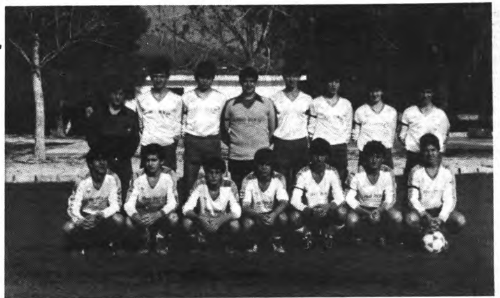
Juveniles C.D. Beato Ramón Llull.

Cuidó de la dirección de este encuentro, como no, el