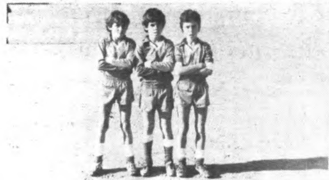
ATL. VIVERO 2 - BEATO RAMON LLULL 0

Los autores de los tantos, serían por parte del Beato Ramón Llull, Tortella y Llompert (2). Mientras que por parte de los visitantes, Casals, Rosselló y Riera, serían los goleadores.