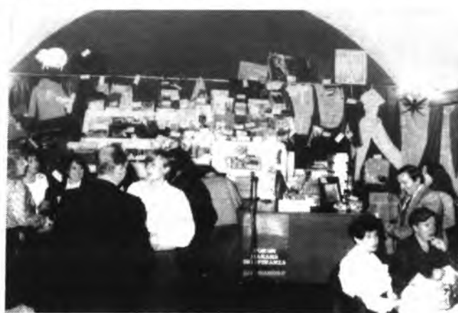
Detalle de la tómbola