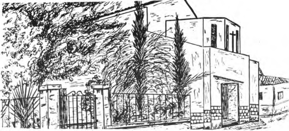
Detalle de la parroquia de Cristo Rey.

El crecimiento de la barrriada es constante y por el hecho de la separación de la barrriada del resto de la ciudad, parece otro pueblo. Una barrriada en la que se ven en la mano muchos obreros migrantes y mallorquines e han venido de distintos puntos de la isla a residir a Inca. Para celebrar este XXV aniversario de la creación de la parroquia de Cristo Rey, la comisión organizadora ha confeccionado un programa para conmemorar esta