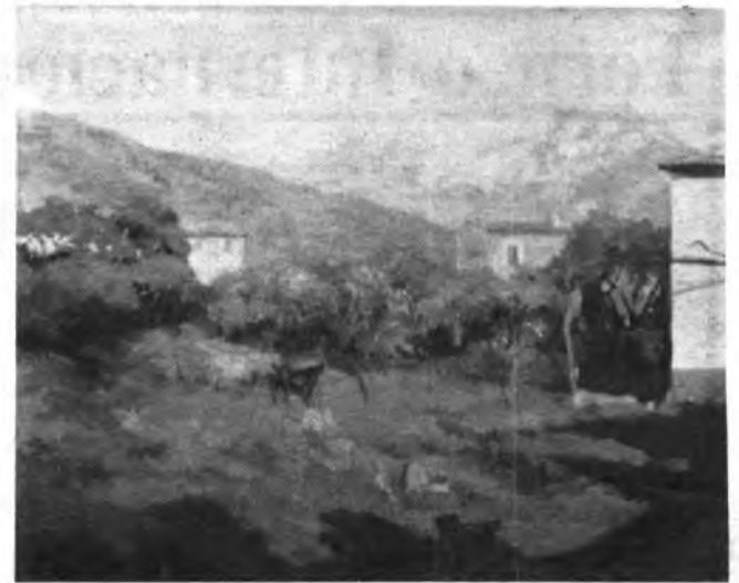
Obra de Maraver.

—Así como el deporte es un terapéutico para la salud física y psíquica de mucha gente. Así también, el arte en general y la pintura en particular es un curativo para el espíritu del hombre, pues por una parte una pintura buena ayuda a ser más feliz al que la posee serenando su espíritu y por otra cultivando su sensibilidad, todo ello contribuye a elevar el nivel cultural y moral de un