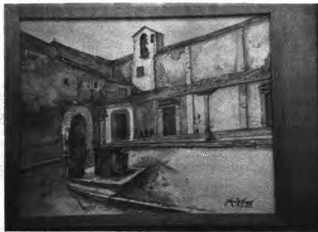
Monaster de Sant Bartomeu, donada al colegio Juan XXIII.