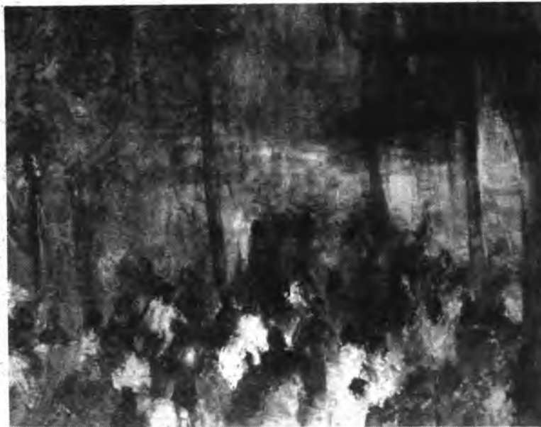
Obra de Antonio Rovira.

El domingo en la parroquia de Santa Maria la Mayor, en el descanso del concierto de l'Harpa d'Inca, se efectuará la entrega del II concurso de belenes Ciudad de Inca, que ha sido organizado por el Grupo Ecologista "Adena Inca", con la colaboración de