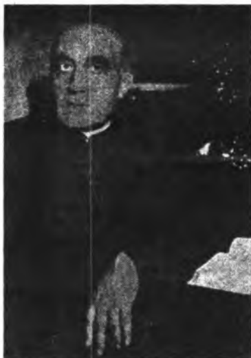
el celebrado autor de la "Minyonia d'un infant orat".

Buena prueba de esta aseveración, es el emotivo homenaje que le fue tributado el último domingo del próximo pasado mes de Octubre, homenaje, que puso de manifiesto, una vez más, el amor que los campanetenses sienten por