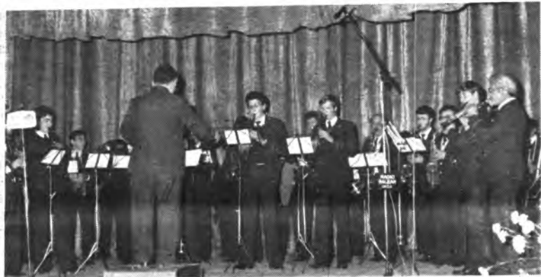
Banda Unión Musical Inquense.