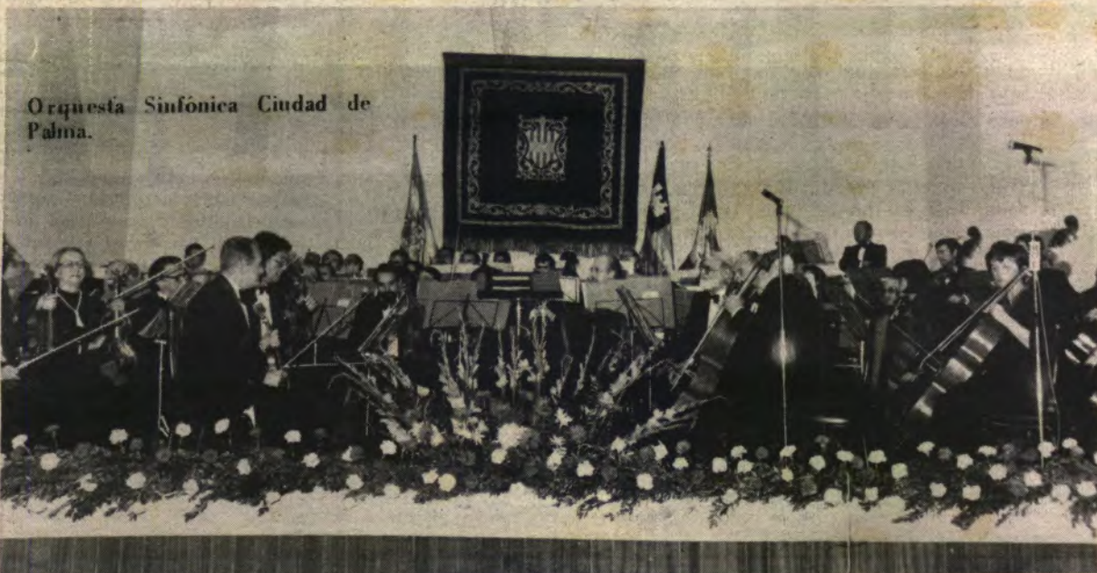
Orquesta Sinfónica Ciudad de Palma.