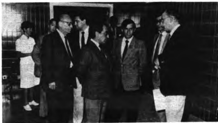
Momento de la inauguración.