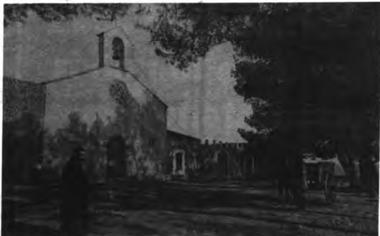
Detalle del Puig d'Inca.

Anteayer martes se registró en Puig de Santa Magdalena por la tarde un incendio, en las inmediaciones de la "Cruz de la Minyó", un importante incendio que por fortuna y gracias a la rápida intervención de Icona no tuvo peores consecuencias.