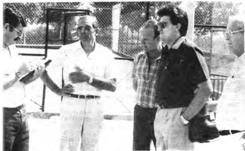
Los responsables sanitarios locales, dialogando con nuestro redactor.