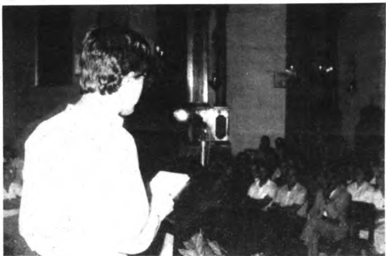
Numeroso público asistió al acto.

El pasado miércoles por la noche, vispera de la fiesta patronal, y dentro del programa de actos conmemorativos del 750 aniversario de la "TROBADA" de la Mare de Deu de Lloseta, fue presentado en el templo parroquial de nuestra localidad al libro "Corona Poètica a la Mare de Déu de Lloseta".