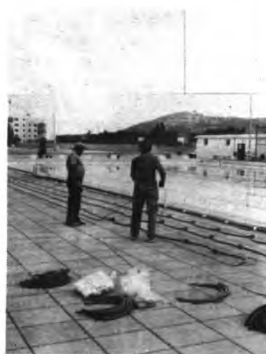
Detalle de la piscina municipal.