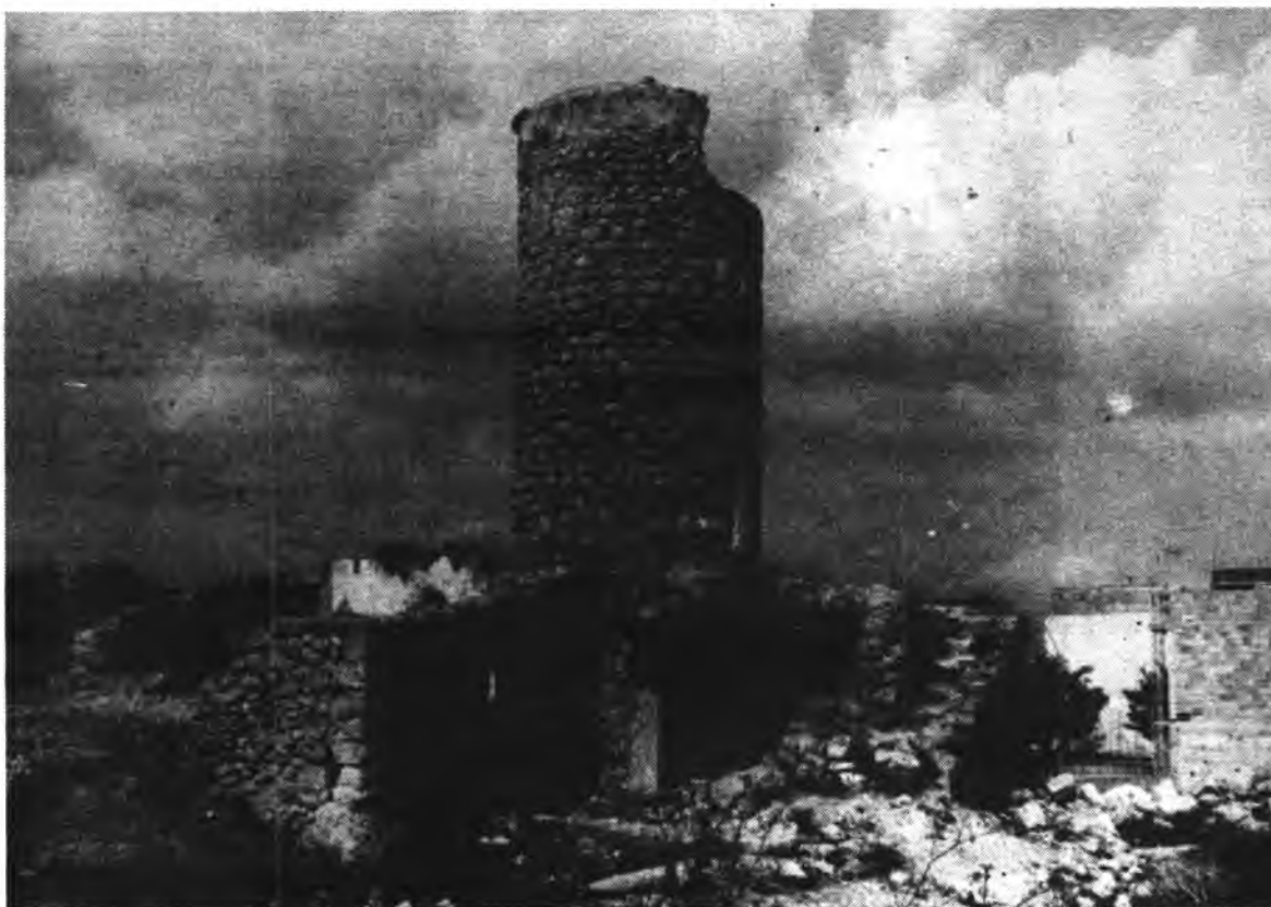
Detalle del molino de la Avinguda d'Alcudia.

En las polémicas "Normas Subsidiarias de la ciudad" y en el nuevo plan de ordenación urbana de Inca, el tema de los molinos de la ciudad eran declarados monumentos a conservar. La zona dels Molins del Serral era zona monumental artística, también se quería conservar todos los molinos del término municipal de Inca.