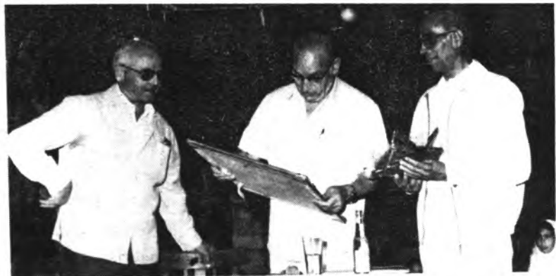
Momento de la entrega de la placa.

Del jueves al domingo se celebraron en Moscardi las tradicionales fiestas patronales. El ambiente estaba un tanto enrarecido debido al cierre del convento de las Hermanas Franciscanas.