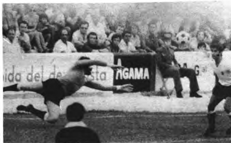
Gost, ex-portero del Constanca.