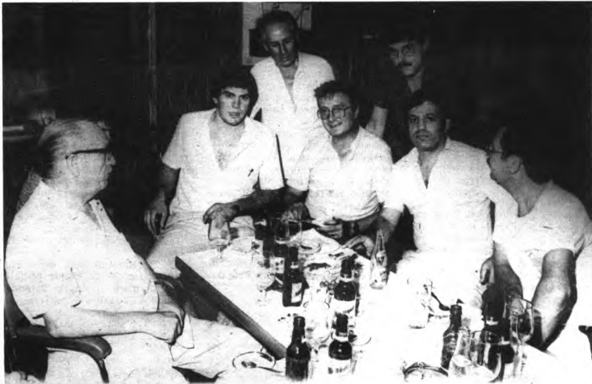
Un momento de la informal "rueda de prensa".

El pasado miércoles, día 27, los animosos y entusiastas chicos de la Peña Blanc i Negre, cambiaron de sede social, pasando de su ubicación en la Gran Vía de Colón, a la calle Miguel Servet, y más concretamente en la Heladería Las Palmeras, local que se inauguraba precisamente aquella misma noche.