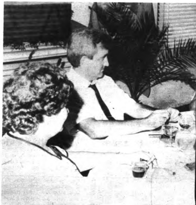
El President de la Comunitat Autònoma en l