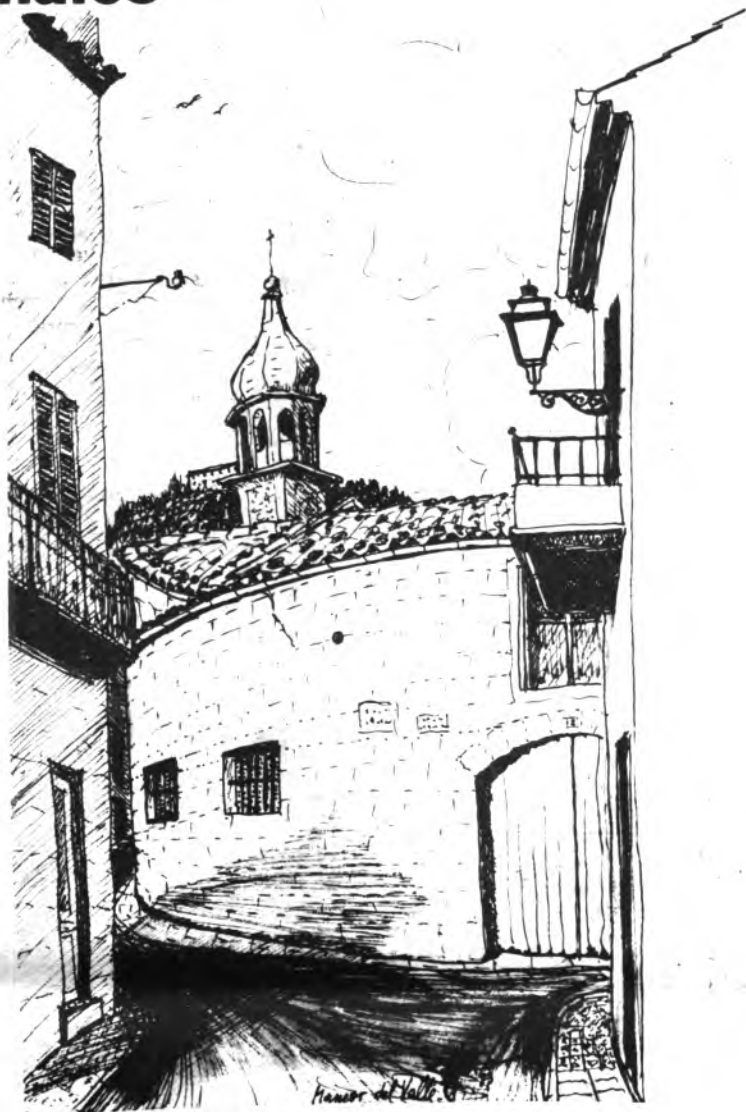
Detalle de Mancor, obra de Robert Jaras.

SABADO DIA 25.- A las 10.- Carreras de Karts.