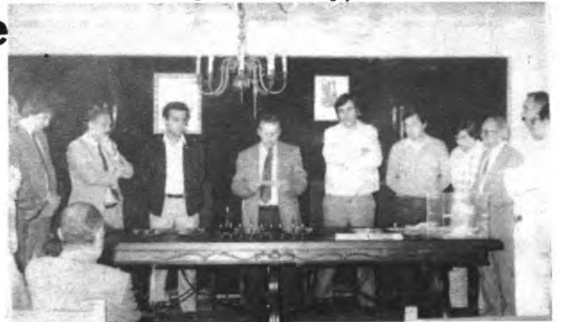
El nuevo ayuntamiento de Lloseta.