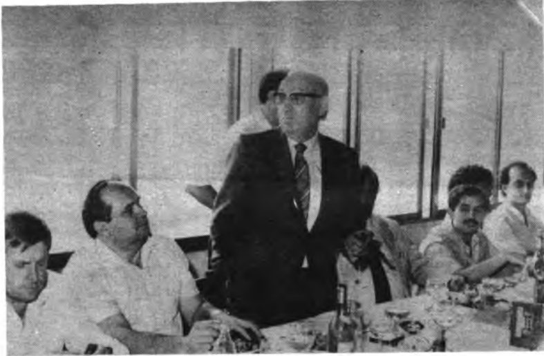
Parlamento del Alcalde.