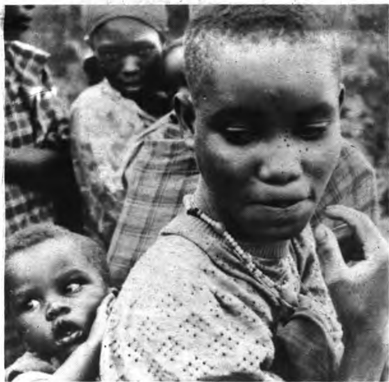
Típica mujer de Burundi, con el niño a la espalda