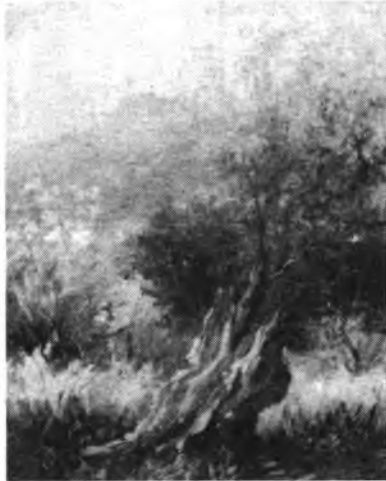
Detalle de olivo de Montejo.

El artista sollerense Jesus Montejo, en el Mercantil de nuestra ciudad, nos muestra una colección de oleos interesante, sobre paisajes y bodegones. El arte y la técnica, conjugan la mas excelsa sinfonia de su obra pictórica. Esta interesante exposición permanecerá abierta hasta el próximo día 31.