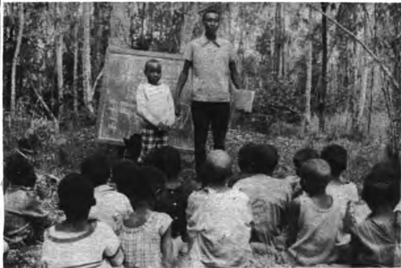
Escuela al aire libre, bajo los Eucaliptus.