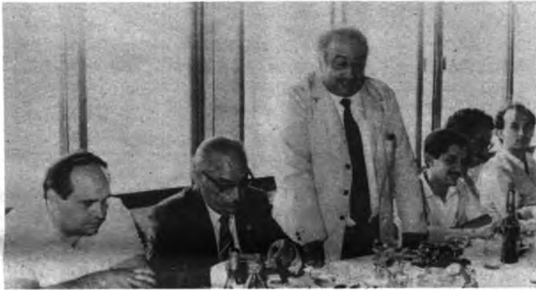
Parlamento del Secretario

El pasado viernes se reunieron en el Puig de Santa Magdalena, los funcionarios del Ayuntamiento inquense para festejar la fiesta de su patrona Santa Rita. A la misma asistieron todos los funcionarios del Ayuntamiento, representantes de la Policía Municipal, Bomberos, Brigada Municipal, el consistorio saliente y la casi totalidad del entrante.