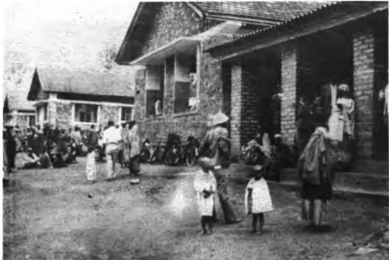
Dispensario de Mutaho