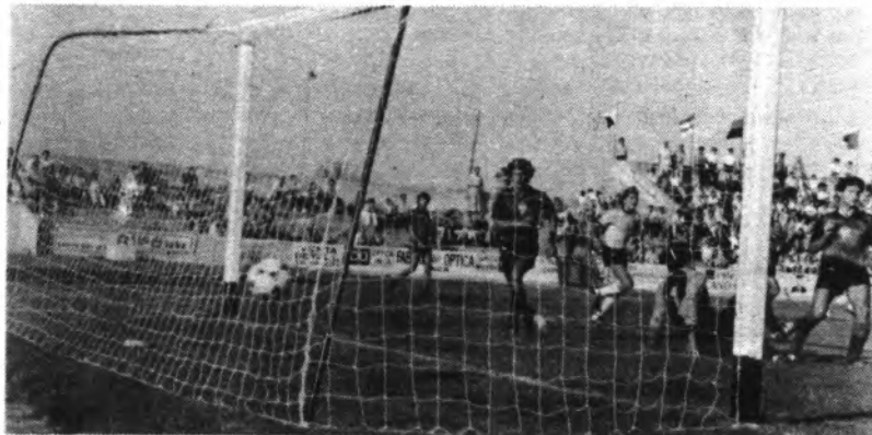
Los inquenses a Selva a ganar.