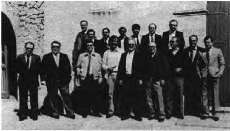
Grupo de Bachilleres del 57.

El pasado sábado un grupo de bachilleres del 57, se reunió para conmemorar las Bodas de Platas estudiantiles. Primero se celebró una misa en la iglesia de San Francisco, por el fallecimiento de un compañero suyo y en acción de gracias.