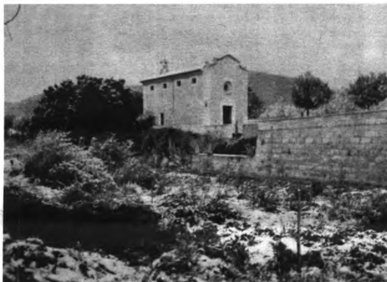
El oratorio, hoy.