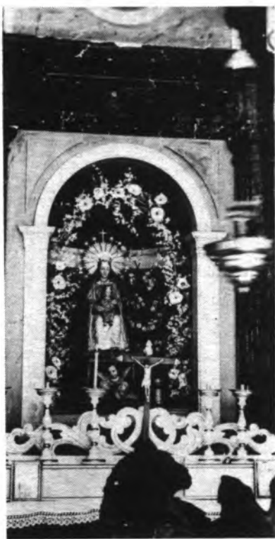
Hasta 1974 fue venerada esta imagen.

En el transcurso del tiempo y desde sus inicios, Lloseta ha sido siempre fiel guardadora de sus tradiciones y muy especialmente de su fé mariana, que fue el motivo de su comienzo y de su actual prosperidad. Una muestra de ello es la tradicional fiesta que el próximo miércoles, primero después de la Pascua de resurrección, se celebra. Se trata de la Romería del Cocó.