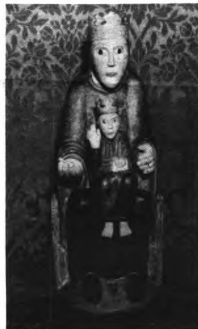
La imagen que hoy se venera.