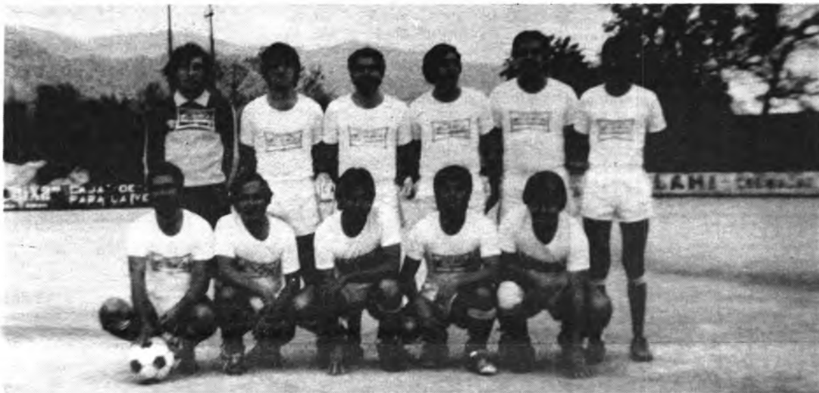
Formación del equipo.