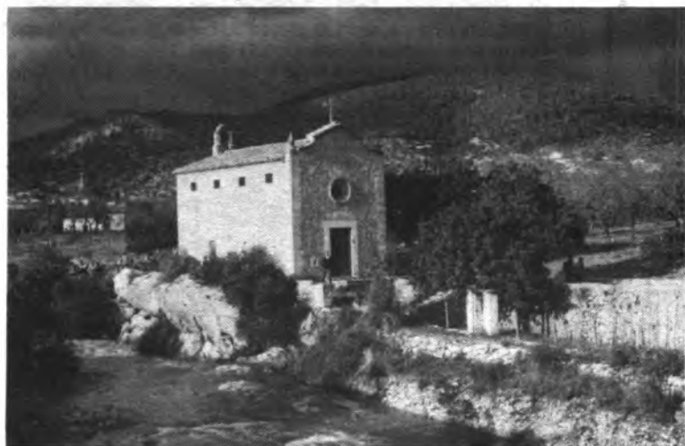
El oratorio del Cocó antes de la reforma de 1976.

Según la tradición en el mismo lugar fue encontrada, en 1233, la Imagen de Ntra Sra. de Lloseta, en cambio, el Oratorio no fue construido hasta 1878