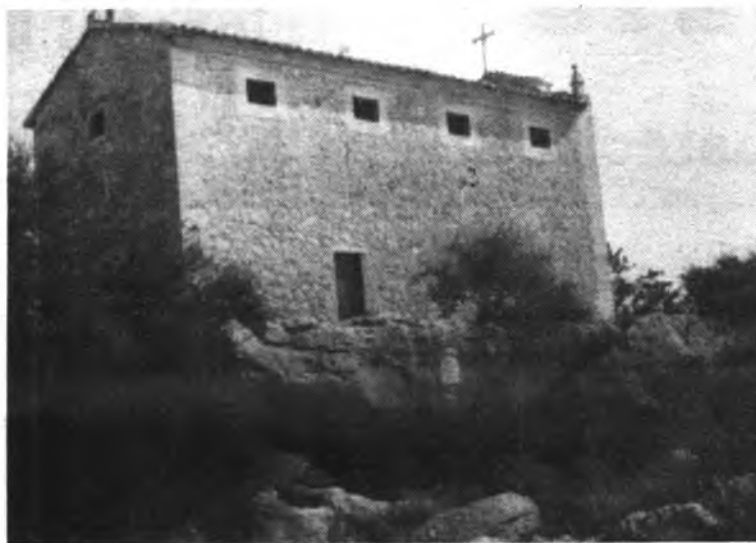
Sobre estos gruesos peñascos, donde fue encontrada la Virgen, se levanta el oratorio.

Así pues, en este lugar tan lleno de historia, de gratos y bellos recuerdos, se celebrará el próximo miércoles la romería más