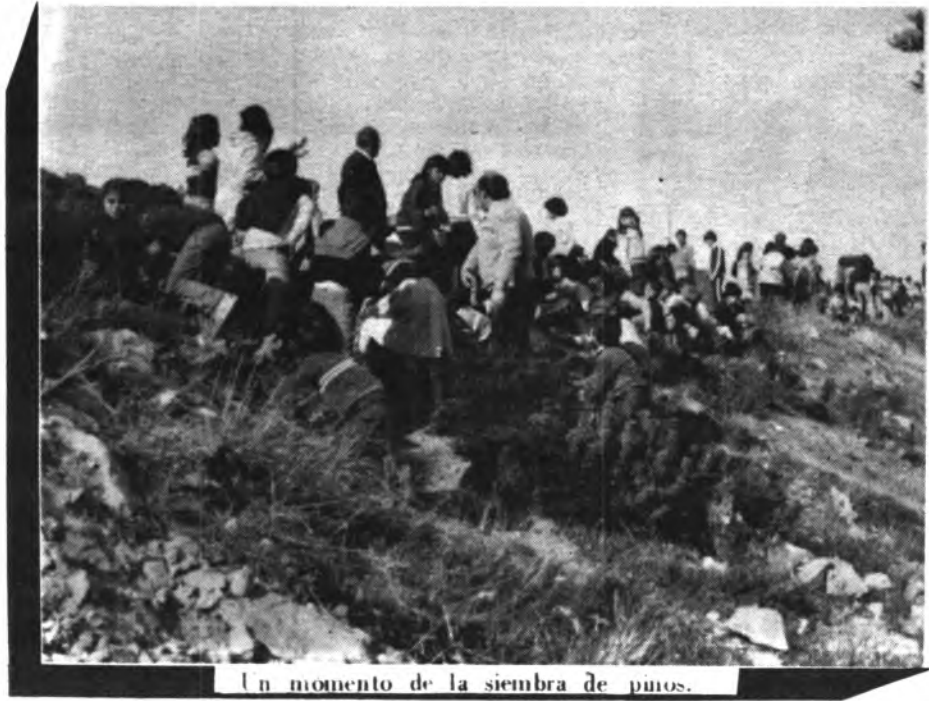
Un momento de la siembra de pinos.

Trés serán las opciones políticas que podrán elegir los vecinos que forman el censo electoral en nuestra localidad.