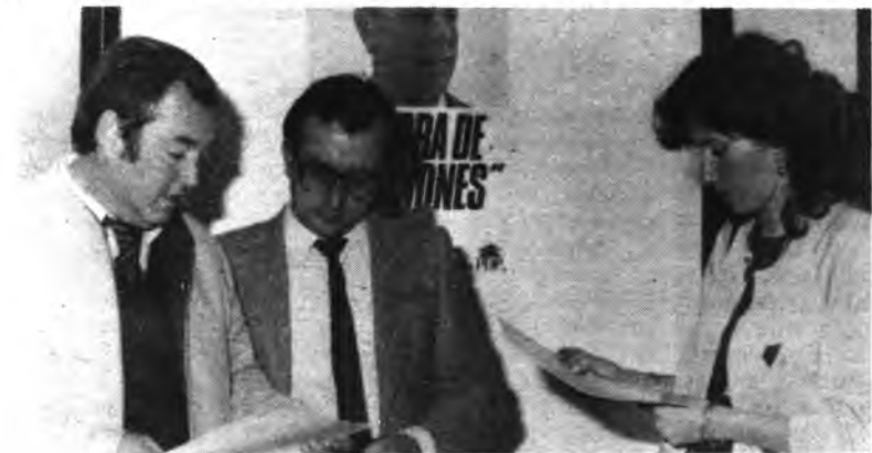
Momento de la presentación