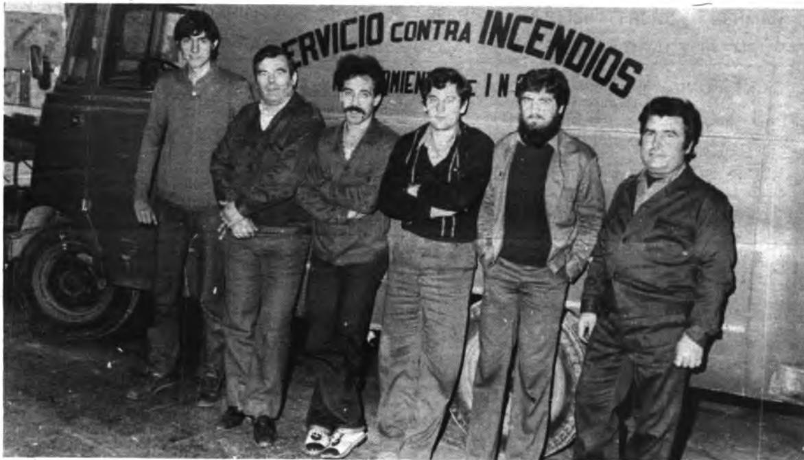
Componentes de la plantilla del cuerpo de bomberos.