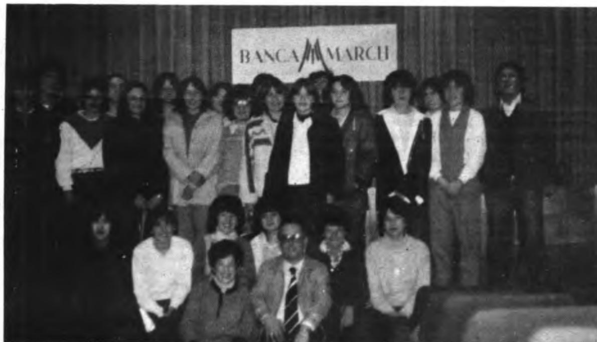
Grupo de alumnos del Colegio Beato Ramón Llull