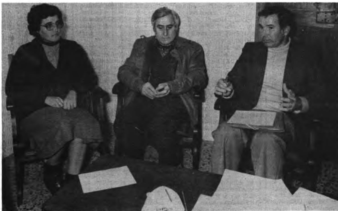
Momento de la Rueda de Prensa.