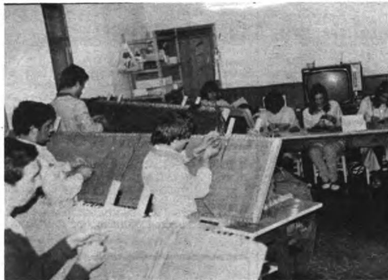
Los niños trabajando en el pre-taller.