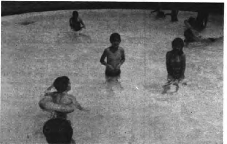
Disfrutando de un baño en los campamentos de verano.