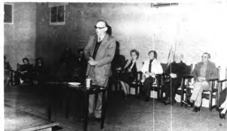
Momento del acto

El pasado viernes día 28 se celebró en el local de Sa Quartera de Inca un emotivo acto de confraternidad de las aulas de Tercera Edad de Palma e Inca.