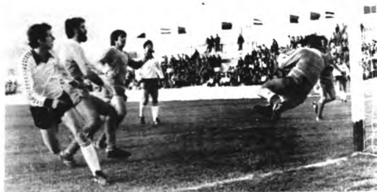
La delantera local debe demostrar su afán realizador.