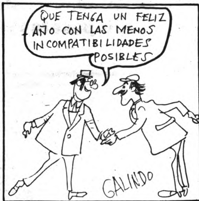
(De "Hoja del Lunes")

Necesitando este ayuntamiento adquirir terrenos rusticos para diversos destinos, se solicita de todos los posibles interesados que presenten sus oportunas ofertas, por escrito, en las oficinas de Secretaría de la Casa Consistorial. LA COMISION DE URBANISMO