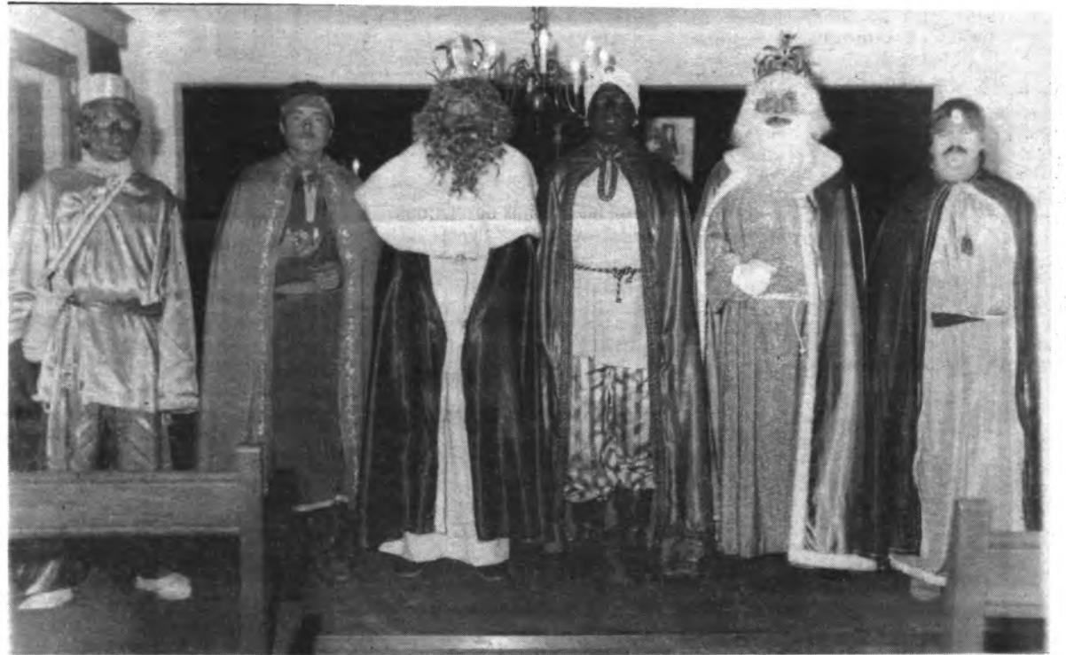
Los Reyes Magos en el Salón de actos de la Casa Consistorial

En la víspera de la festividad de los Reyes tuvo lugar en nuestra localidad una magnífica cabalgata que recorrió las principales calles de la población. Visitó el ayuntamiento y también el templo parroquial, tras lo cual, y en la plaza de España se procedió a la entrega de juguetes y regalos a la grey infantil.