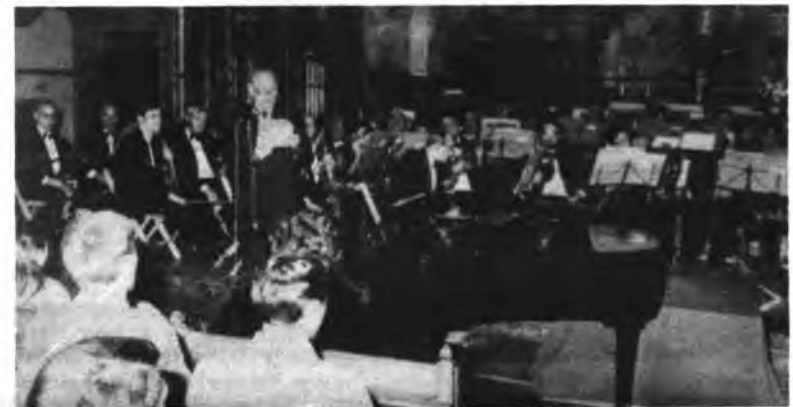
Orquesta Ciudad de Palma

En su magnífico recital interpretaron dos piezas de Salas Ave María y El meu xabes, que