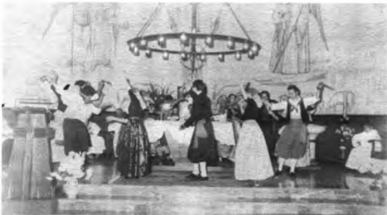
Momento del vall de l'oferta.

Este fin de semana ha tenido lugar en la populosa barriada de Passat Es Tren, las fiestas de la parroquia de Cristo Rey, con una serie de actos que tuvieron lugar el sábado y domingo.