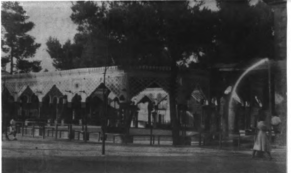
Aspecto de la Plaza de Mallorca, en los años 50.

- La Plaza de Mallorca, es una de las obras con las que han topado algunos consistorios sin poder conseguir esta Plaza que toda la ciudad esperaba y deseaba. La Plaza fué remodelada con motivo del Congreso Eucarístico del año 1960, en la época del mandato de Alfonso Reina, se hizo un proyecto de lo que tenía que ser la Plaza, peto solamente ha quedado en proyecto, ya que dista mucho de ser lo que todos confiaban. Luego en el mandato del anterior consistorio comandado por Fluxá, se dijo que se solucionaría esto pero terminó su mandato sin conseguir solucionar este problema. Ahora está a punto de terminar su mandato el primer Consistorio Democrático de la ciudad, pero todo sigue igual.