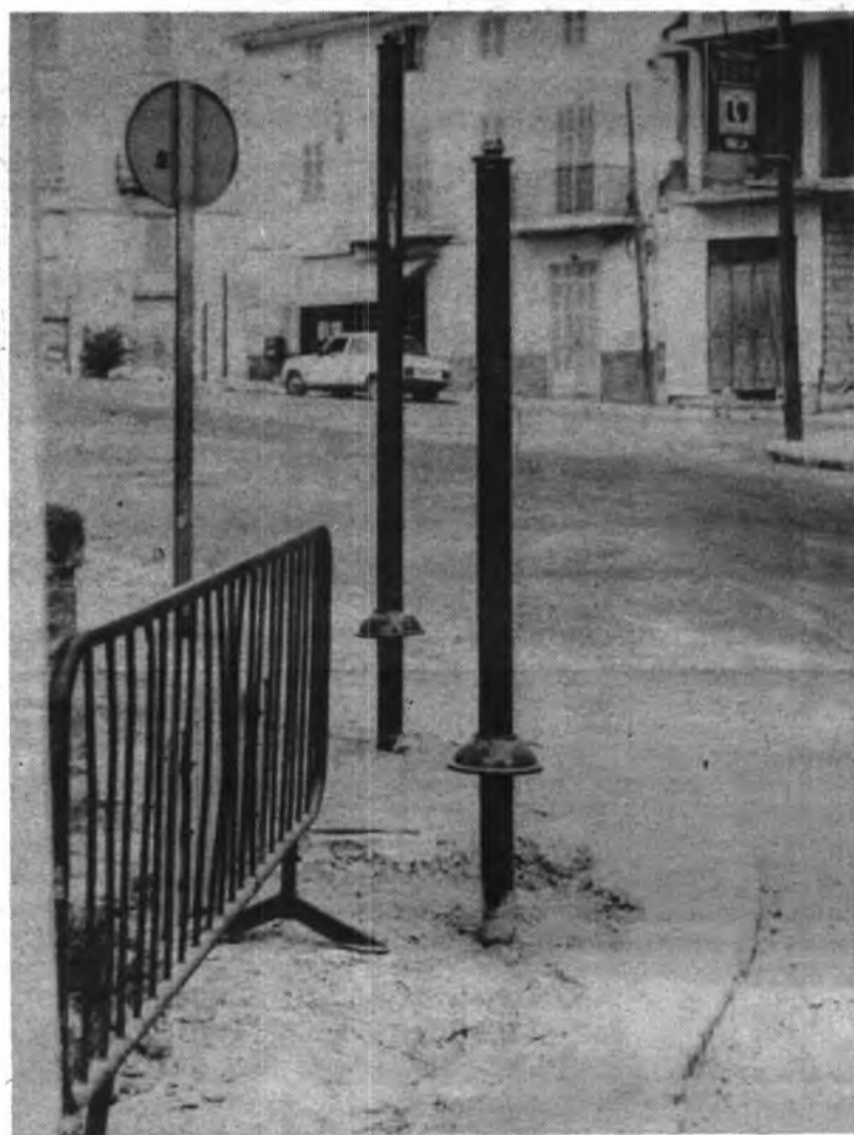
Han finalizado las obras para la instalación de los semáforos en el centro de la ciudad, obras que se han realizado en un tiempo

record. Es que las fiestas estaban a un paso y la mayoría municipal quería terminar las mismas para las fiestas. El Ministerio de Obras Públicas ha asfaltado la zona donde tienen que estar enclavados dichos semáforos: calles de Artá, Barco, Avenida de Alcudia, Plaza de Oriente y Coc.