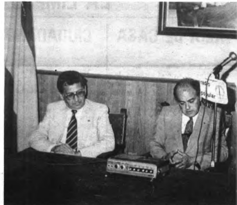
Momento del parlamento del Alcalde

"El 'ja soc aquí', de L'Honorable Tarradellas, ha conseguido carta de naturaleza en las tertulias inquenses. Su tenacidad, o necesaria insistencia (pero no más) empleada en la hora difícil de la transición". "Os anuncio que os encontráis en una ciudad mallorquina, que industrialmente hablando,