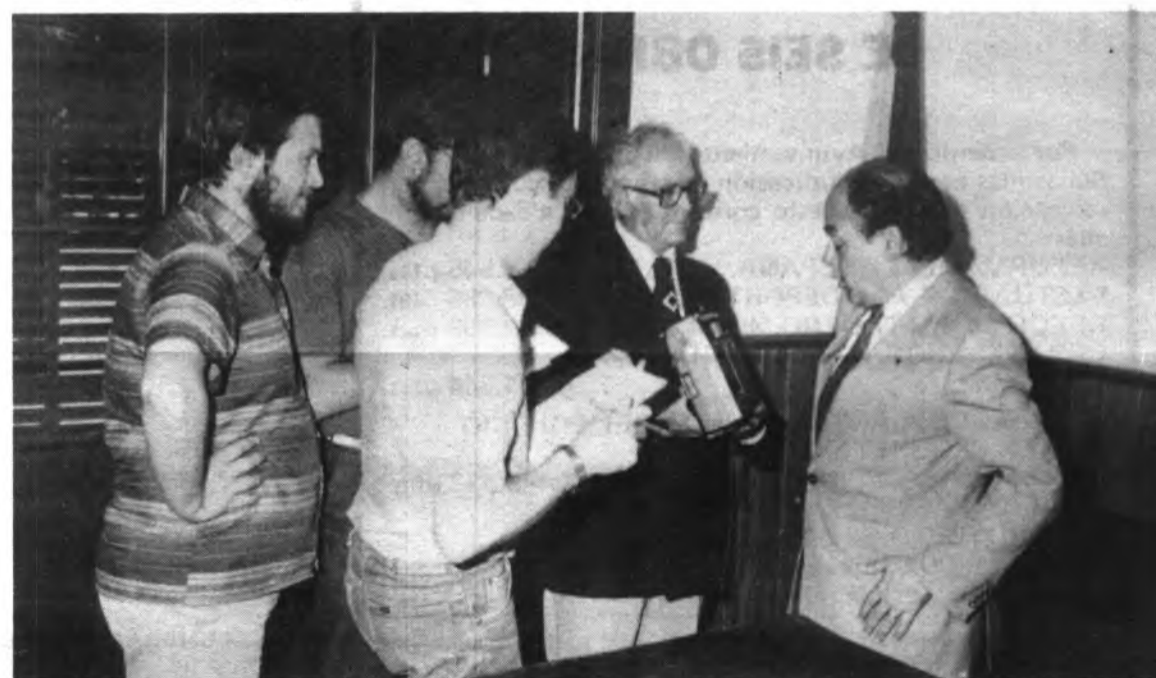
L'Honorable Jordi Pujol, con los medios informativos inquenses.

"No soy la persona adecuada para decir si sería interesante un partido en las islas como 'Convergencia i Unió'"