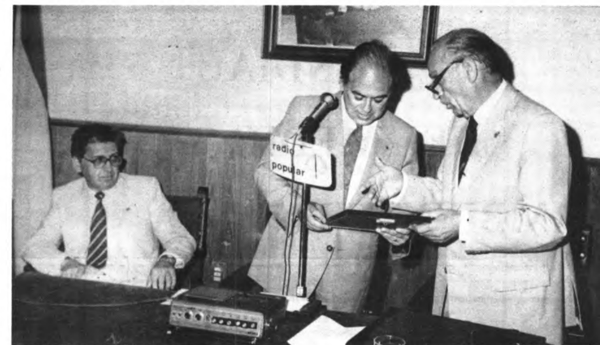
El Alcalde hace entrega de unos obsequios a Jordi Pujol