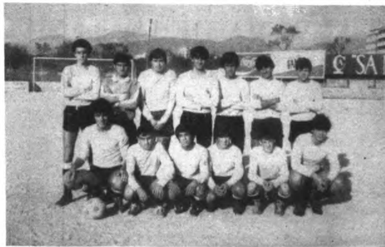
Equipo del Juventud Deportiva Inca