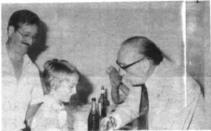
El alcalde entrega el trofeo al goleador benjamín.

Luego habló el presidente del club que dijo que se había ganado este torneo, pero que tenían que seguir luchando para poder ser campeones, dio las gracias a la directiva y manifestó que la próxima temporada tendrán un equipo en la segunda división juvenil.