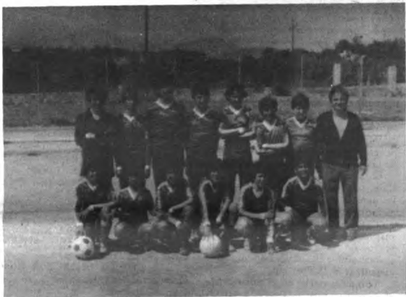
Alevín At. Inca.

SE VENDE en Moscarí solar junto plaza, haciendo esquina. Precio interesante. Tel. 501515.