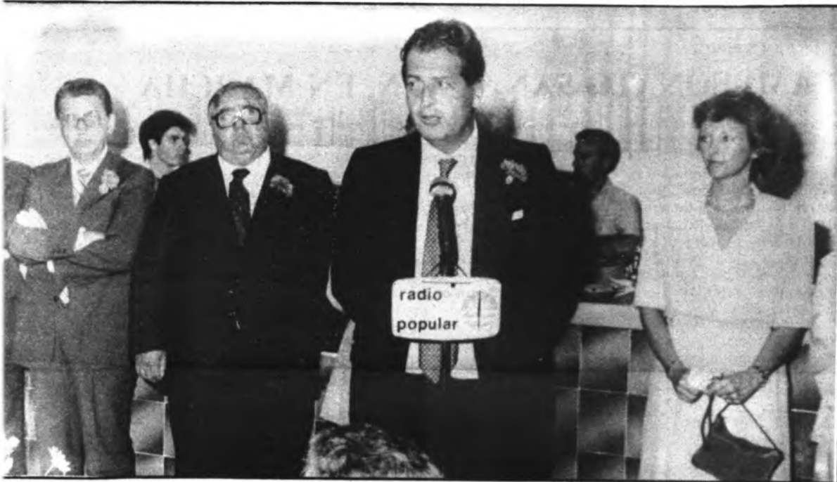
Momento del parlamento