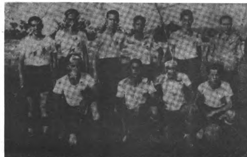
Equipo que venció al Soledad 30-0.

SE VENDE SOLAR 600 m2. BONAIRE (ALCUDIA) TELEFONO 50 10 69