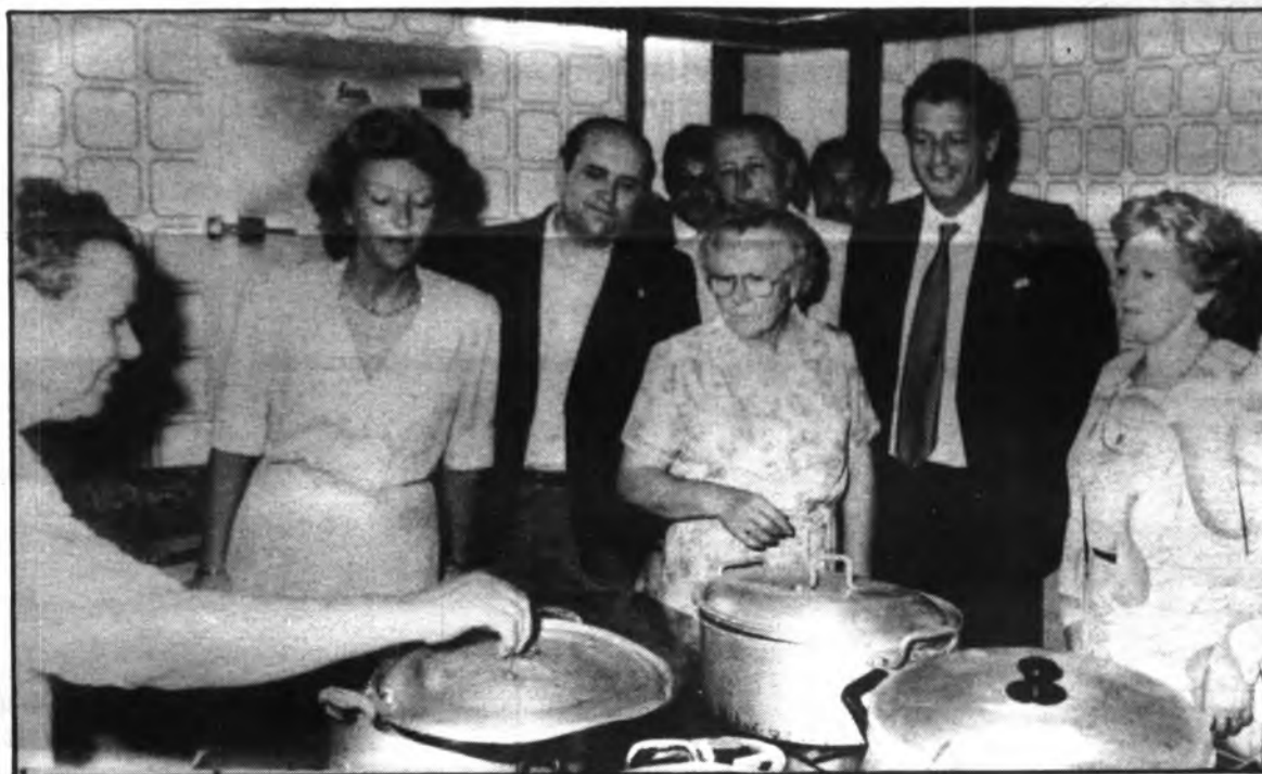
Visita a la Residencia de Ancianos.