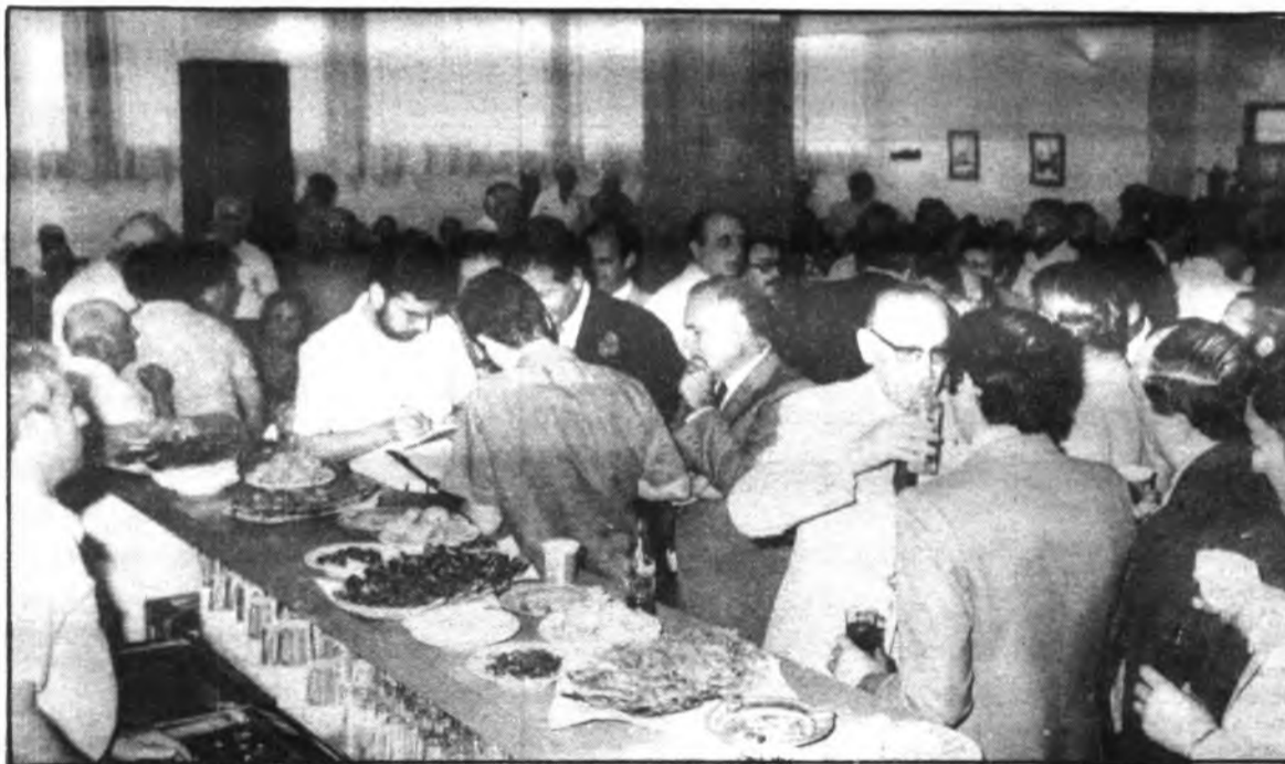
Aspecto de la sala.