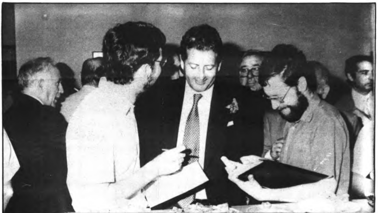
Momento de la entrevista del Ministerio con los representantes de la prensa inquense.