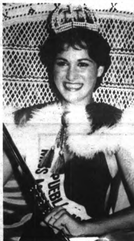
Miss Mallorca 81