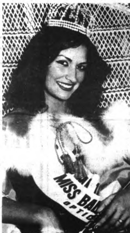
Miss Balears 81