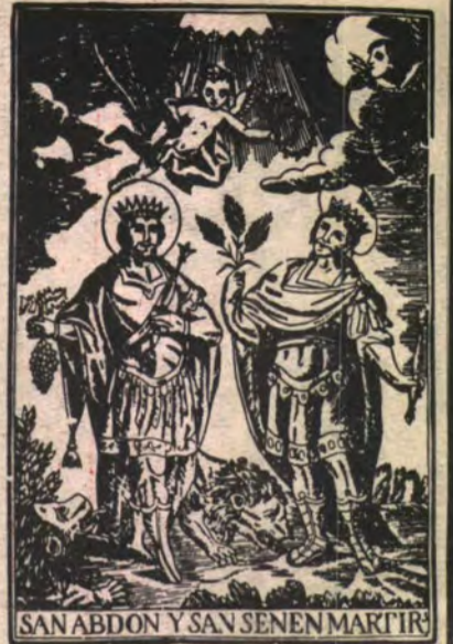
CULTO Y PATRONATO Inca 1982

PRESENTACION DE LA COLECCION DE MONO- GRAFICAS INQUERAS "XIMBELLI"