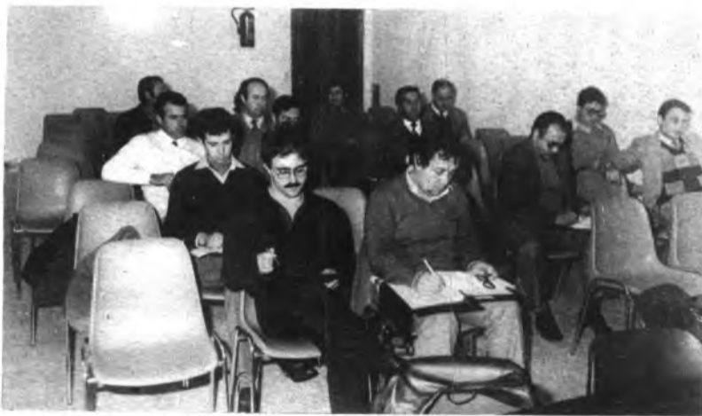
Momento del cursillo

¡SI TU CALLE ESTA SUCIA, NO TE QUEJES, COLABORA! ENTRE TODOS, UNA CIUDAD MEJOR