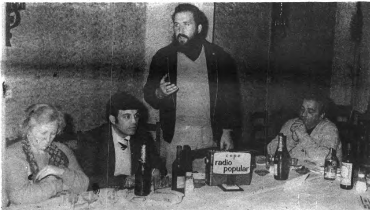
El Subdirector de "Dijours" en su parlamento

Comparar...no es comprar Comprar sin comparar, no es corriente ¡Ahorrrará dinero!, comprando en MUEBLES decoración