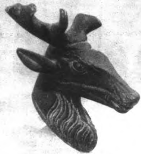
Segunda cabeza de ciervo de bronce hallada recientemente en el término de Lloseta.