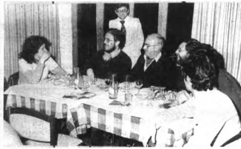
Momento de la cena.

LOS REPRESENTANTES DE LA PRENSA EN EL SPORT INCA