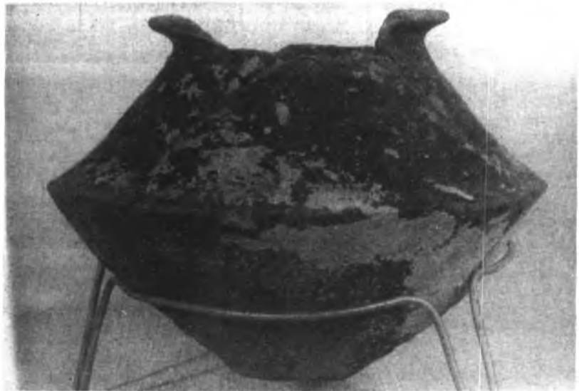
Vasija pretalayótica bitroncocónica de “Sa Cova des Moros”.