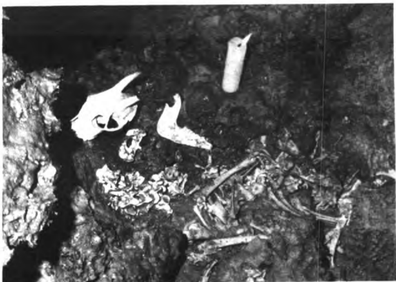
Restos del “Myotragus” encontrados en “Sa Cova des Moros”.