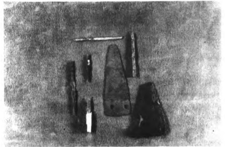
Bronce procedentes de “Sa Cova des Moros”.