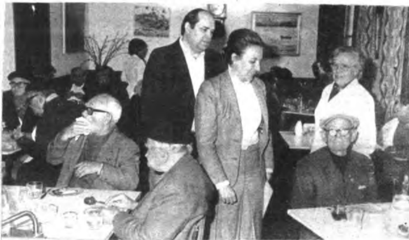
La directora general en su visita a la Residencia de Ancianos.